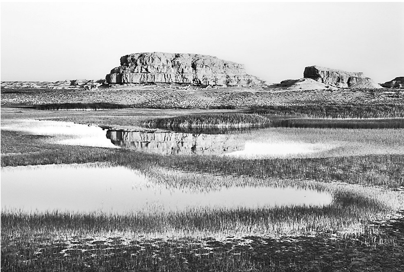
敦煌南泉湿地 孙志军

（《大敦煌：一部山川地理、古往今来的敦煌路书》，孙志军著 王瑞智编，湖南美术出版社出版。本文为该书序言之二）