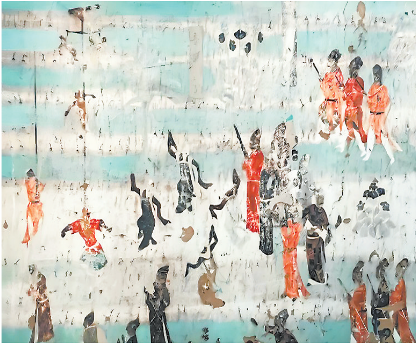
宋国夫人出行图 莫高窟第156窟 晚唐

《《敦煌壁画中的衣食住行》,胡同庆著,文物出版社出版。本文系该书的前言,有删节)