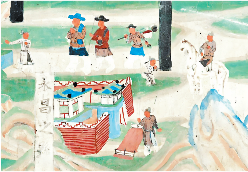
五台山图(局部) 莫高窟第61窟 五代

不管在什么时代,衣食住行对于每一个人来说,都是首先面临的、最需要解决的基本问题。