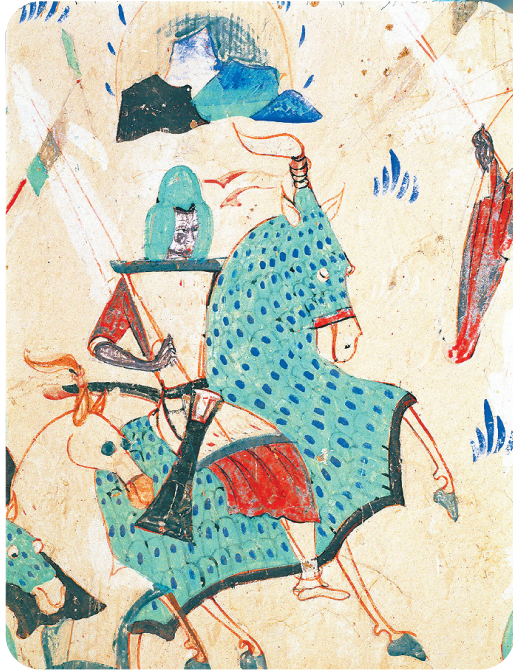
莫高窟第285窟南壁 骑兵戎装

在古老的丝绸之路上,有一处艺术的圣地——敦煌,岁月的流转与千年的风沙,在这片土地上留下了太多的故事与传奇。