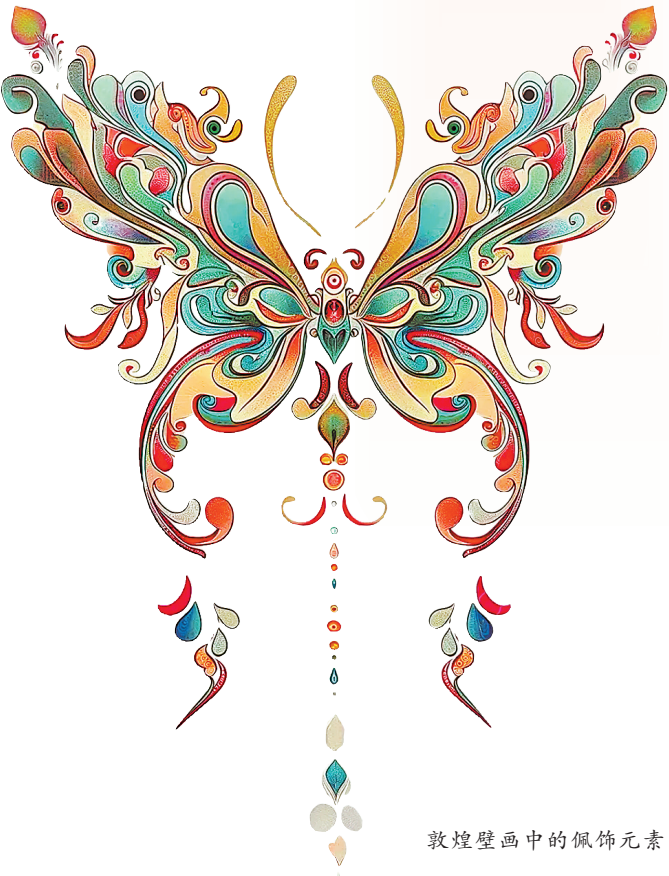
敦煌壁画中的佩饰元素

壁画作为人类最古老的绘画形式之一,早期主要依附于自然环境中的洞穴、崖壁和岩石上,展现出原始的艺术魅力。