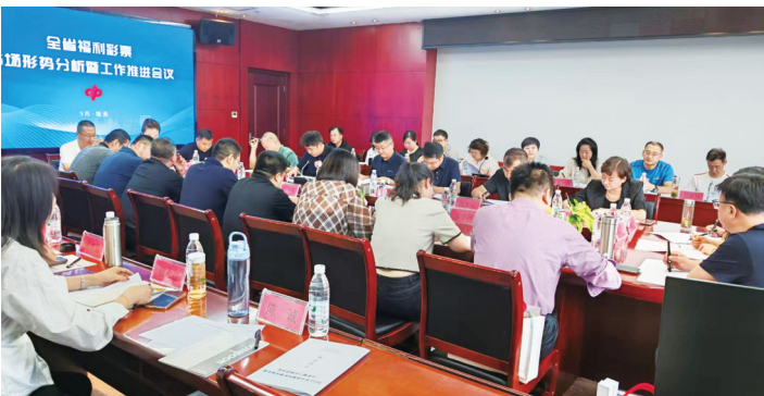
2025年全省福利彩票市场形势分析暨工作推进会议现场。

9月9日,2025年全省福利彩票市场形势分析暨工作推进会在陇南召开。会议传达了全国福利彩票市场形势分析暨系统统一工作推进会议精神,回顾并总结了2025年上半年我省福利彩票发行销售管理工作,全面部署了下半年福利彩票工作任务。 分析会上,省福彩中心相关业务部室负责人汇报了今年1月至8月我省福利彩票即开票、电脑票销售管理和渠道拓展工作推进情况,并结合市场实际及全国福利彩票发展形势,对全省福利彩票目前的发展状况和在现阶段遇到的困难、面临的挑战、存在的机遇等进行了详细分析研判,提出对策建议及下一步工作思路。各市州福彩中心主任分别对上半年市州福彩工作亮点、难点堵点进行讨论并提出意见建议。 会议指出,上半年全省福彩系统牢牢把握福利彩票的政治性、人民性、公益性,坚持稳中求进工作总基调,持续强化规范管理,全面提升发展质效,各项工