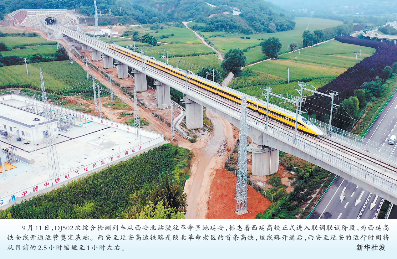
9月11日,DJ502次综合检测列车从西安北站驶往革命圣地延安,标志着西延高铁正式进入联调联试阶段,为西延高铁全线开通运营奠定基础。西安至延安高速铁路是陕北革命老区的首条高铁,该线路开通后,西安至延安的运行时间将从目前的2.5小时缩短至1小时左右。

与此同时,海洋油气成为增储上产的主力,2024年海洋原油增量占国内原油增量的70%以上。我国海洋药物研发能力跻身世界前列,自主研发的海洋药物占全球已上市品类的28%。海运量和集装箱吞吐量占全球的三分之一。海洋旅游2024年产业增加值达1.6万亿元,邮轮旅游、海洋研学热度高涨,海洋变身“幸福打卡地”。