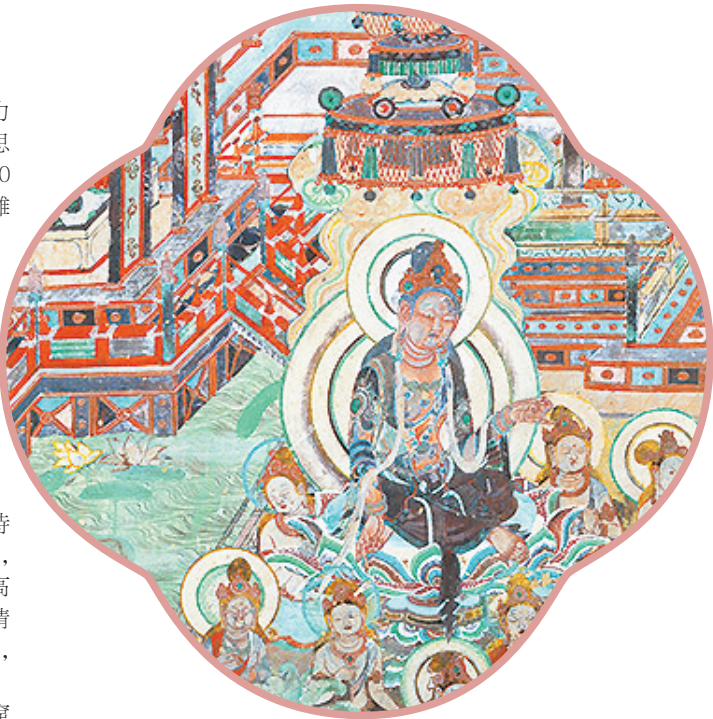
▲莫高窟第201窟南壁观无量寿经变壁画中的配殿与角楼

麦积山同莫高窟及炳灵寺石窟相比,这一历史时期,除隋朝新开凿个别洞窟外,唐代几乎没有新开洞窟;然而在旧窟中填补的塑绘仍然不少。那些补作,一方面继承前代的精良技法,如第5窟的薄肉塑飞天,沿袭北周时期的技法;另一方面塑像着彩更加普遍,前代上彩不重彩,甚至直接用素泥表现佛像质感的独特手法,很少再见于这一时期。佛像造型,隋朝保留南北朝时期的风格。唐朝造像则明显地表现为丰腴圆润,有别于魏晋南北朝时期造像清瘦的特点。