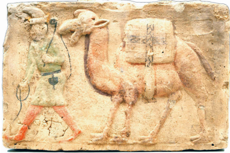
唐模印胡商牵驼画像砖 山丹县博物馆藏

2001年4月,甘肃庆阳庆城县发现的唐游击将军穆泰墓,出土了一批精美的陶塑俑,包括陶天王俑、陶镇墓兽俑、陶袒胸胡人俑、陶文官俑、陶牵夫俑、陶侍女俑、陶参军戏俑、陶骆驼马牛羊俑等,内容相当丰富,可以代表甘肃隋唐时代墓葬雕塑的水平。