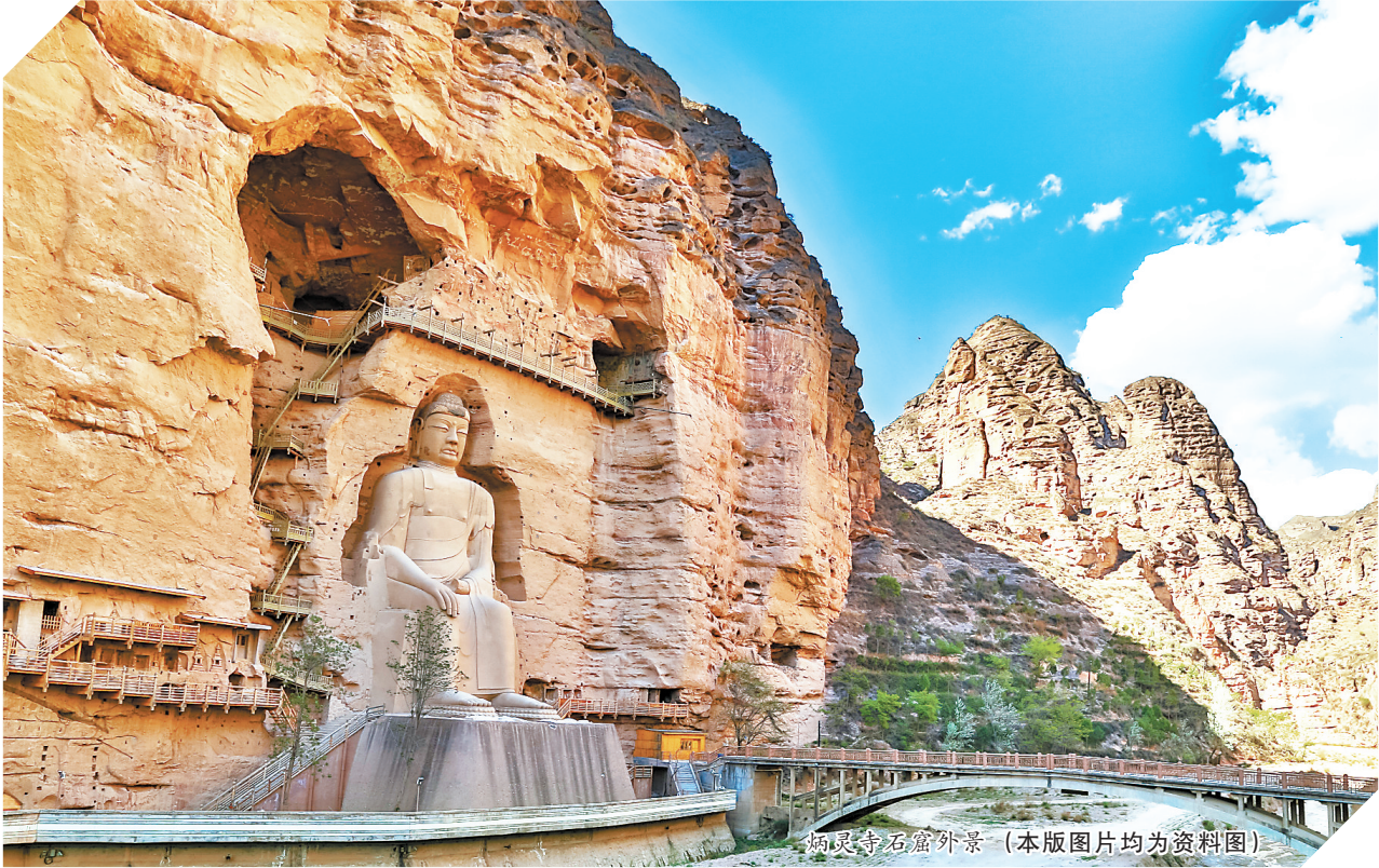
炳灵寺石窟外景(本版图片均为资料图)

这一时期,甘肃的墓葬壁画也很丰富。平凉灵台县、庆阳庆城县、河西酒泉果园乡西沟唐墓、张掖山丹中学校址唐墓、武威天祝县岔山村吐谷浑慕容智墓都有唐墓壁画。敦煌佛爷庙湾唐墓出土的模印砖画,还沿用我国自战国秦汉以来即已出现的制作模印砖的形式,将画和雕两种技术结合起来,较快、大批地模制出许多砖面浮雕,既是实用的建筑材料,又是生动的艺术品。尤其可贵的是它不仅制造出传统的龙、虎、朱雀、玄武四神和怪兽的形态,还在砖块上绘雕出商胡牵驼等反映“丝绸之路”中西方联络、贸易的砖雕画,使这里的模印砖画显示出明显的地域特征。