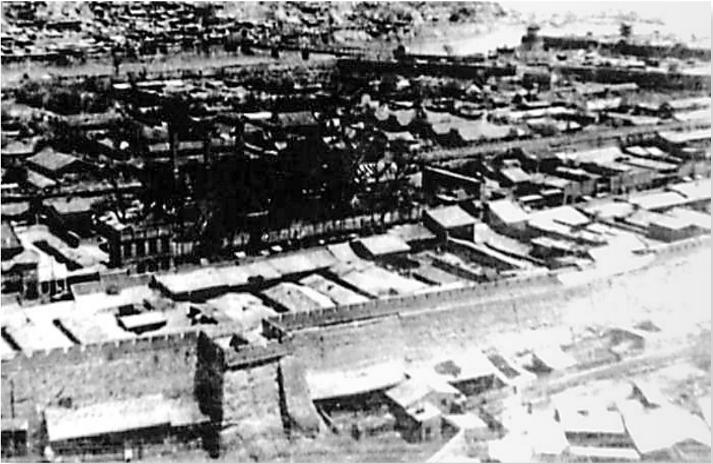
20世纪30年代的兰州城。

2月12日上午10时30分,敌3个轰炸机队29架飞机从运城机场起飞,按预定计划直扑兰州。由于领航判断失误,先遣的第12战队9架飞机,全部向北偏航,将兰州东北约100公里外的祖厉河误认为是兰州以南的洮河,将靖远县城误认为是兰州,便将54枚50公斤重的炸弹全部投了下去。其余20架轰炸机于下午2时到达兰州上空,展开了轰炸。此时,原在空中担任阻击任务的的中国空军第17中队发现市区内有大量烟尘升起,而敌机群的位置比我机更高。于是纷纷向高空爬升,向敌机展开追击。由于担任防空任务的中国空军第17中队未能预先在外围空域拦截住敌机,直到敌机投弹后才发现并追击,故未能在空战中击落敌机。