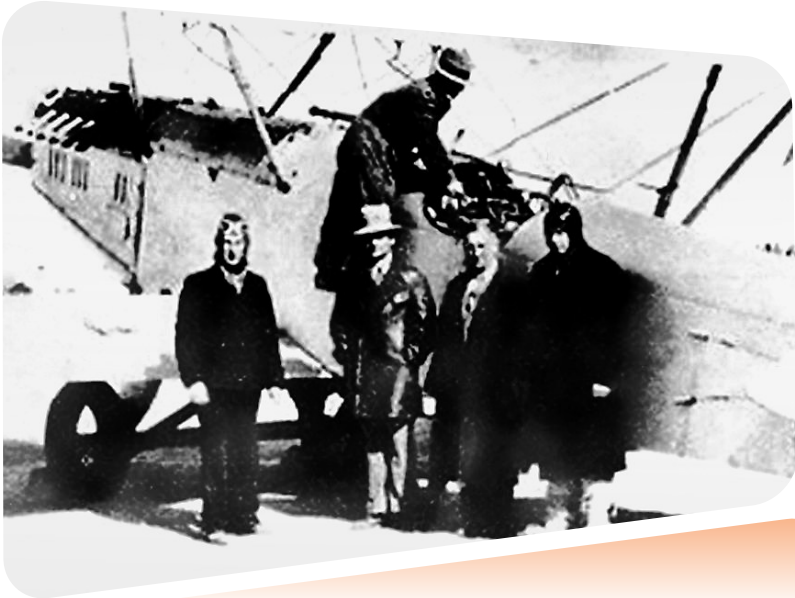
▲苏联提供的第一批援华飞机于1937年10月至1938年2月陆续飞抵兰州。图为交接时的合影。

全民族抗日战争期间的中国空军,在中国抗战史上留下了浓墨重彩的一笔,中国空军以其顽强的战斗意志和无畏的牺牲精神,极大地鼓舞了中国人民的抗战信心。中国人民抗日战争期间,中国空军和苏联志愿航空队并肩作战,在兰州空域联合抗击日军空袭中,通过紧密合作、共同协作,击落日本军机多架,其中1939年2月20日至23日的空战,成为抗战时期击落日军飞机最多的一次空战,创下了抗日战争期间中国空军空战歼敌最多的辉煌战果。