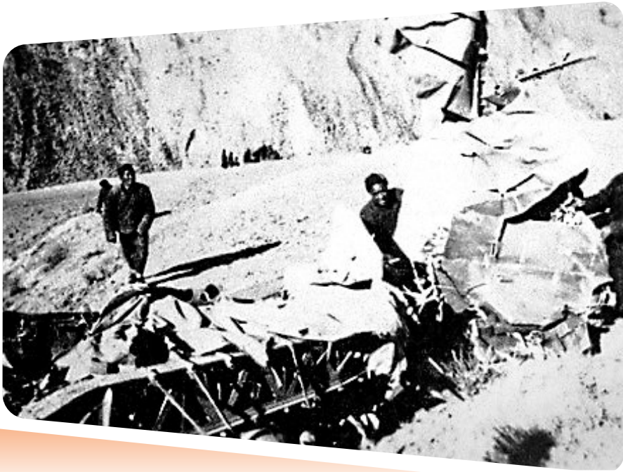
▲兰州空战中被击落的日机残骸。