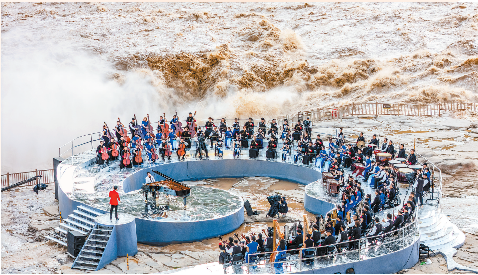
“《黄河回响》——纪念抗战胜利暨台湾光复80周年两岸音乐会”在山西吉县黄河壶口瀑布岸畔举行。闫锐鹏

1939年3月26日至3月31日，连续6个昼夜，冼星海坐在延安简陋的窑洞土炕上，把他对祖国命运的关注，对民族灾难的忧愤，对革命战争的颂扬，对抗战胜利的信心，全部倾诉