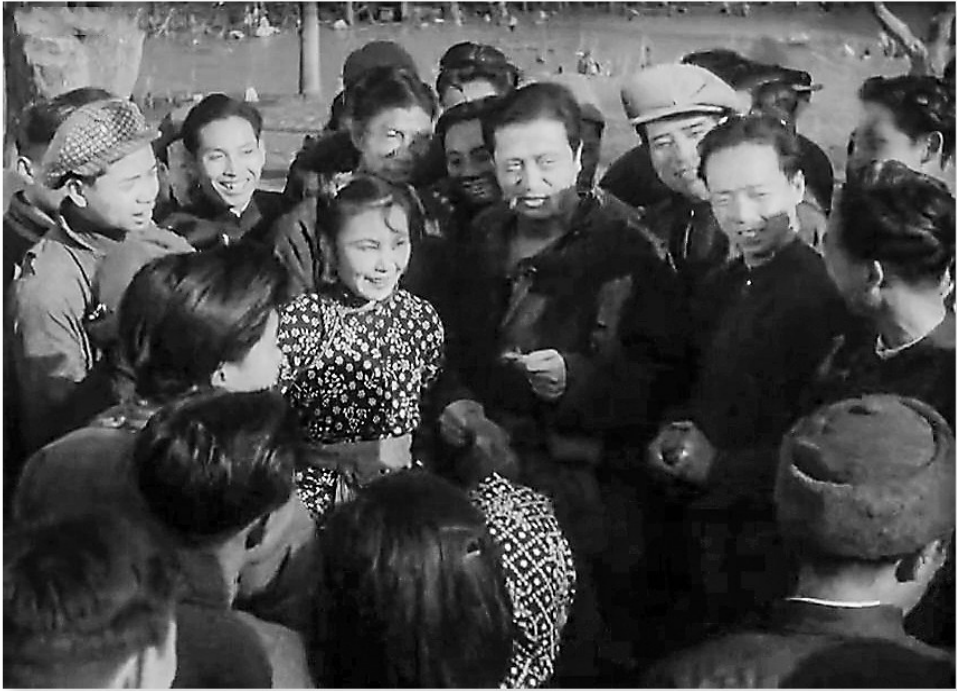
《八千里路云和月》剧照