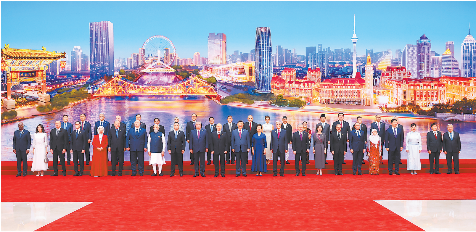
8月31日晚,国家主席习近平和夫人彭丽媛在天津梅江会展中心举行宴会,欢迎来华出席2025年上海合作组织峰会的国际贵宾。这是宴会前,习近平和彭丽媛同贵宾们集体合影留念。

新华社天津8月31日电(记者马卓言 李鲲)8月31日晚,国家主席习近平和夫人彭丽媛在天津梅江会展中心举行宴会,欢迎来华出席2025年上海合作组织峰会的国际贵宾。 海河之畔,灯光璀璨。 出席峰会的上海合作组织成员国、观察员国、对话伙伴国、主席国客人等20多位外国国家元首、政府首脑及配偶,联合国秘书长等10位国际组织负责人陆续抵达。礼兵列队致敬。伴随