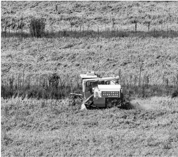
8月22日,农民驾驶收割机在江苏省句容市天王镇戴庄村收割水稻。处暑节气将至,农民抢抓农时开展农事劳作。

刘彬还就上合组织重要意义、中方担任主席国工作、“上合组织+”会议和上合组织未来发展等答问。