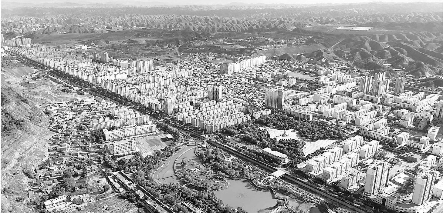
近年来皋兰县交通建设全面开花,城乡面貌焕然一新。