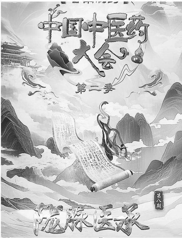
本文配图 为《中国中医药大会》(第二季)《陇脉医承》的海报和节目照

时对世界文明也产生了深远影响。 甘肃作为中医药文化的发源地之一,蕴藏着丰富的医学资源:从河西走廊的“武威汉简”到敦煌壁画的“医学图像”,从《黄帝内经》的医理智慧到《针灸甲乙经》的针灸奥秘,这片沃土为中医药文化发展提供了深厚滋养。《中国中医药大会》(第二季)第八期节目《陇脉医承》将镜头聚焦甘肃,通过创新的视听语言与叙事手法,生动展现了陇原大地源远流长的医脉传承。节目以现代科技手段诠释传统医学智慧,带领观众领略甘肃中医药文化的独特魅力,让古老的中医智慧焕发光彩。