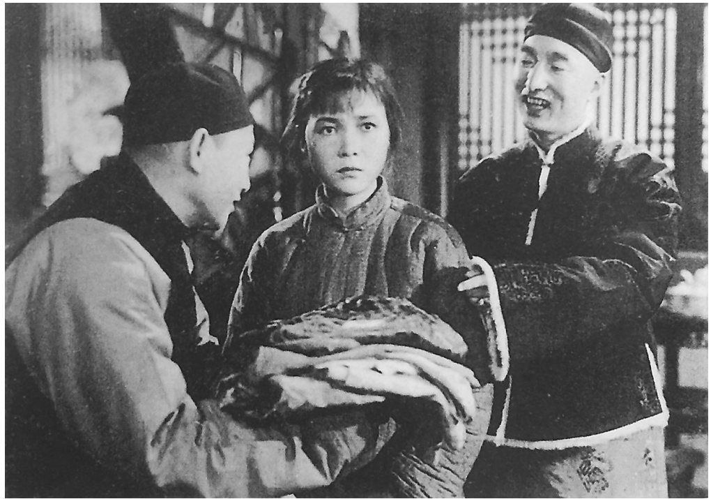
1951年上映的电影《白毛女》剧照

1950年,东北电影制片厂改编拍摄了故事片《白毛女》,1951年上映。1964年,上海舞蹈学校又编创了芭蕾舞剧《白毛女》。自此,白毛女的故事传遍海内外,充分发挥着艺术作品的感染力。(作者系八路军兰州办事处纪念馆原馆长)