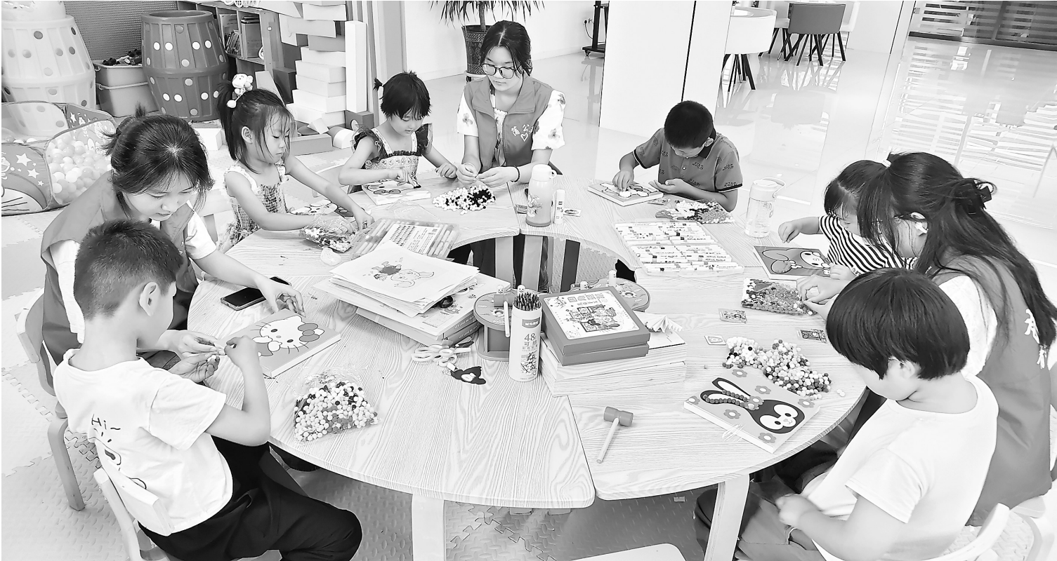
张掖市山丹县北街社区农家书屋里志愿者正在教孩子们做手工。