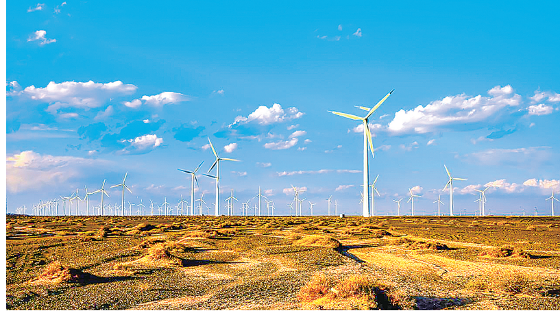
瓜州风电场。 赵文生

子成了“碳库”。“这49.7万亩林子,每年能‘吸’掉13万吨二氧化碳,听说以后还能实钱。”他说的正是林业碳汇项目,预计40年计入期全市林业碳汇总收益可达40亿元。“庆阳模式”不仅实现了生态资源的有效保护和利用,还通过碳汇交易等方式促进了农民增收和地方经济发展。