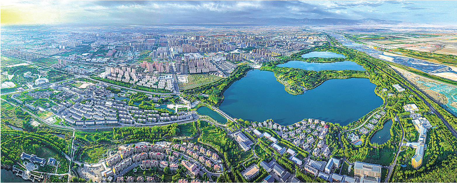
甘州区水云乡生态公园美景如画。 脱兴福

从祁连之巅到黄河之滨,从河西走廊的风沙口到陇南山地的林海间,一场关乎国家生态安全、牵系百姓福祉的绿色革命,在陇原大地澎湃涌动。我省深入贯彻落实习近平生态文明思想,将绿水青山就是金山银山理念融入血脉、化为行动,坚决筑牢国家西部生态安全屏障,以前所未有的决心和力度,书写着“两山”转化的甘肃实践。