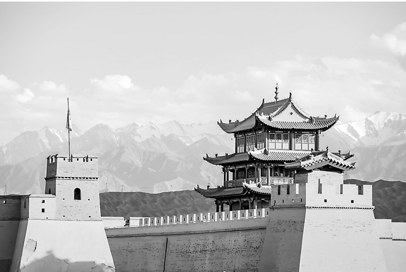
嘉峪关关城与祁连雪山交相辉映。郎兵兵