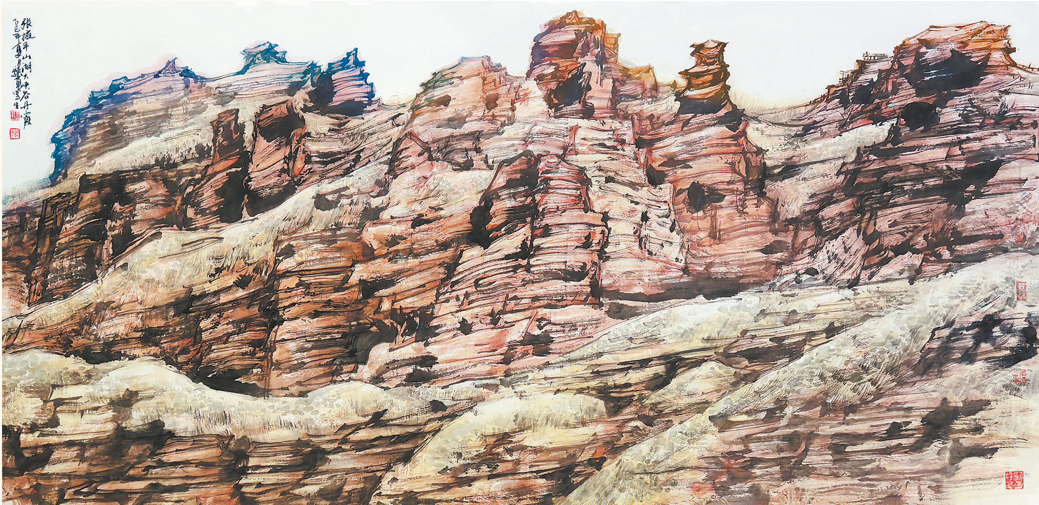
张掖平山湖大峡谷 (中国画) 王晓勇

“美术里的新时代——中国美术家协会‘深入生活、扎根人民’大采风活动暨‘跟着艺术游甘肃·穿越河西’全国美术家张掖采风写生活动”日前举行。此次活动由中国文联指导,中国美术家协会、甘肃省文化和旅游厅、甘肃省文学艺术界联合会主办。