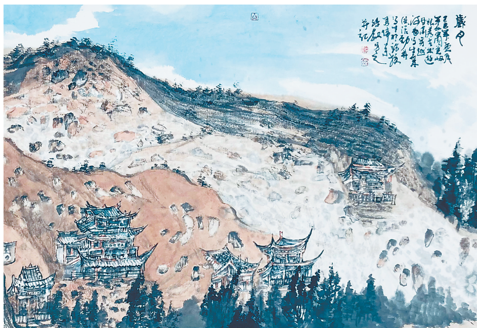
岁月 (中国画) 孙剑