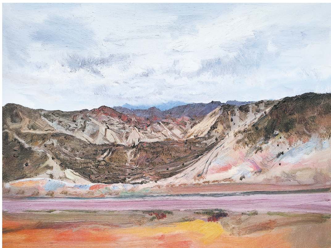
七彩丹霞 (油画) 陆庆龙