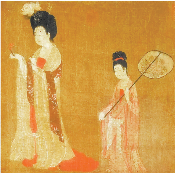
唐 周昉 簪花仕女图(局部)

团扇和折扇的绢帛、纸质的扇面,非常便于文人墨客在上面题诗作画,因而也形成了独特的扇面艺术,使得扇子除了实用价值,也给人们带来了审美上的享受。