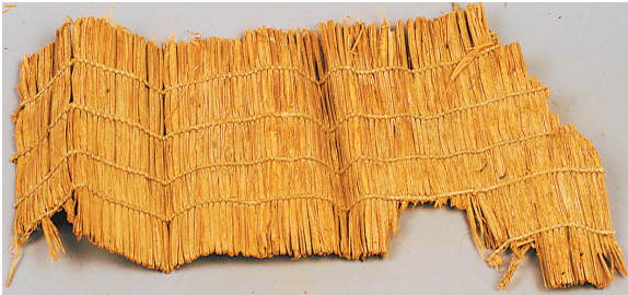
悬泉置出土的草编帘席