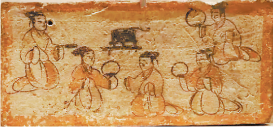
彩绘贵妇宴享图壁画砖 嘉峪关市新城魏晋壁画墓出土