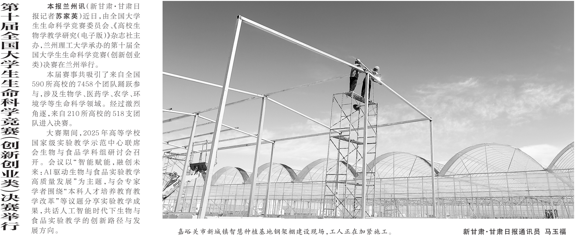
嘉峪关市新城镇智慧种植基地钢架棚建设现场，工人正在加紧施工。

博物馆有业务往来的企业负责人提供的宴请；多次违规收受民营企业主所送高档酒水、香烟等礼品和礼金、购物卡；长期超标违规配备使用办公用房。贾建威还存在其他严重违纪违法问题，2025年6月被开除党籍，按规定取消相应退休待遇，涉嫌犯罪问题被移送检察机关依法审查起诉。 甘肃交通职业技术学院党委委员、副院长王运周收受可能影响公正执行公务的购物卡问题。2021年至2023年，王运周在春节、端午、中秋等节日期间多次收受承揽该校工程项目的承包商所送购物卡。2025年4月，王运周受到党内严重警告处分。 兰州市第二人民医院党委书记刘雄昌长期接受可能影响公正执行公务的宴请，违规收受礼品，借用民营企业主车辆问题。2012年至2025年2月，刘雄昌在担任兰州市第一人民医院党委书记、副院长，兰州市第二人民医院党委书记及延迟退休、以专家身份继续工作期间，多次接受民营企业主安排的宴请，饮用高档酒水，相关费用由对方支付；违规收受私营 企业主所送高档酒水等礼品；长期借用民营企业主车辆。刘雄昌还存在其他严重违纪违法的典型，反映出个别党员干部对全面从严治党认识极不清醒，持续高压态势下仍不收敛、不收手、不知止。必须清醒看到，“四风”问题树倒根存、土壤尚在，存量未尽、增量依然易发多发，贯彻中央八项规定精神、深化纠治“四风”必须打持久战。各级党组织要坚决扛起主体责任，深化拓展深入贯彻中央八项规定精神学习教育成果，动真碰硬、重拳纠治违规吃喝、违规收受礼品礼金等“四风”突出问题，持续筑牢中央八项规定堤坝。各级纪检监察机关要牢牢把握习近平总书记关于从严监督执纪要进一步落实到位的重要要求，坚持风腐同查同治，对“四风”问题露头就打，严肃查处，一严到底、寸步不让，切实把严的氛围营造起来、把正的风气树立起来。