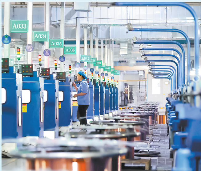
白银有色长通电线电缆有限责任公司的微细电磁线车间,一台台拉丝机高速运转。

着25594面定日镜。每3至6秒,这些定日镜会自动调整一次角度,将太阳光精准反射到吸热塔上。距离这阵列不远处,是长达数公里、如波浪般连绵起伏的蓝色光伏板。