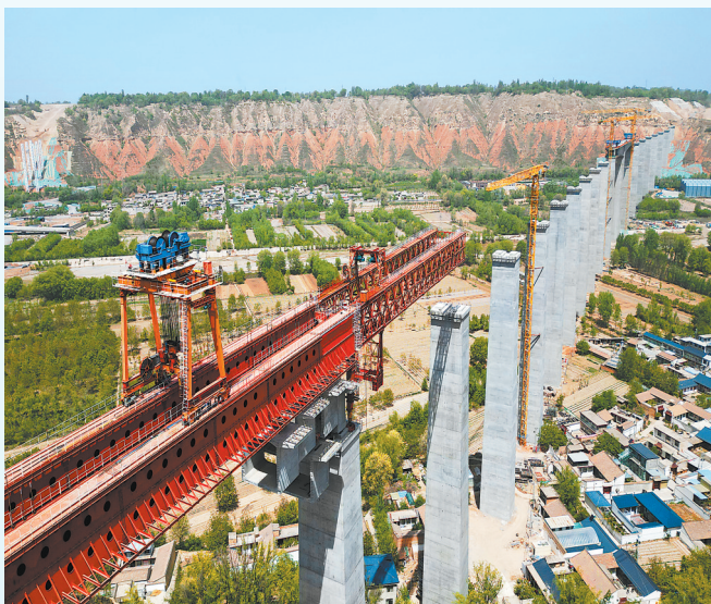
兰合铁路北小墩大夏河特大桥正加紧建设。