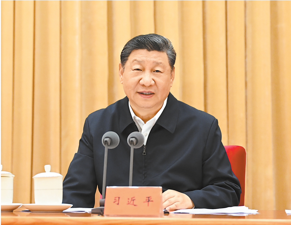
7月14日至15日，中央城市工作会议在北京举行。中共中央总书记、国家主席、中央军委主席习近平出席会议并发表重要讲话。

新华社北京7月15日电 中央城市工作会议7月14日至15日在北京举行。中共中央总书记、国家主席、中央军委主席习近平出席会议并发表重要讲话。中共中央政治局常委李强、赵乐际、王沪宁、蔡奇、丁薛祥、李希出席会议。