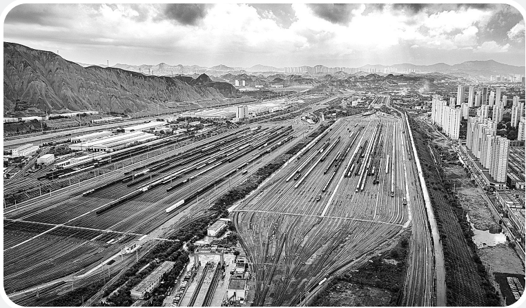
6月30日,由中铁二十一局承建的兰州北编组站扩能改造工程完成联锁设备换装并正式开通运营。兰州北编组站是贯通东西的重要铁路货运枢纽。改造完成后,车站车流中转效率预计提升40%,年货运吞吐量将增加500万吨。袁飞

“老师好,刚刚我在带旅行团,现在闲一点了……”这是一位甘肃交通职业技术学院的学子,向老师讲述最近的工作和生活情况。这位失去双亲的学子,自立自强,刻苦努力。这位学子今年顶岗实习即将结束。由于优秀的专业水平和突出的工作表现,实习单位最终决定,待顶岗实习结束后正式录用他。目前他已经可以独立带旅行团开展工作。