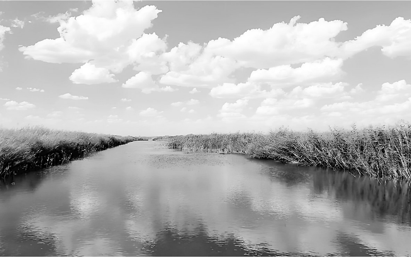
青土湖风光 西凉农夫