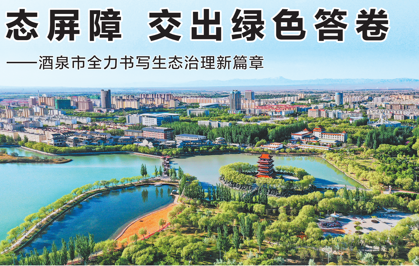
玉门市玉泽湖公园。