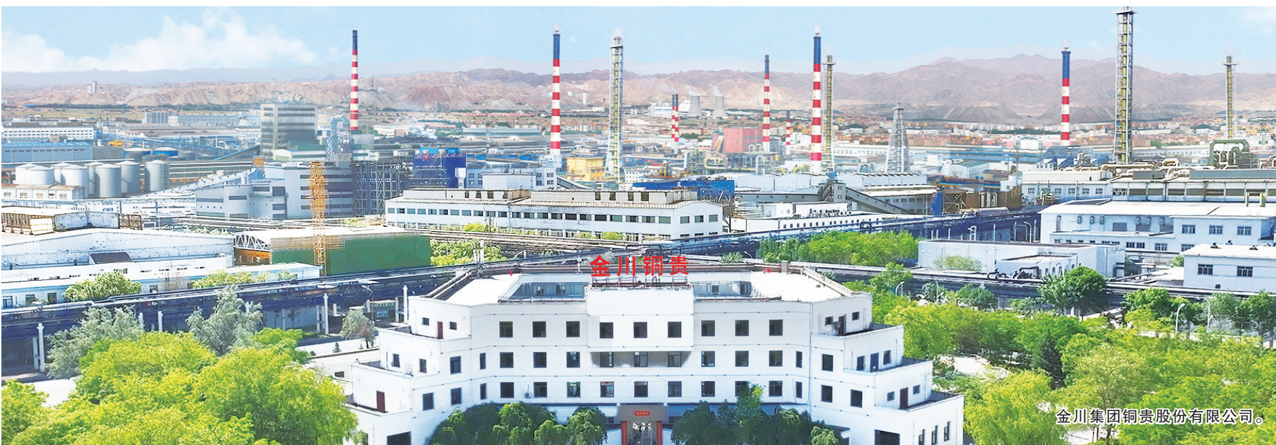
金川集团铜贵股份有限公司。

6月19日,金川集团铜贵股份有限公司(以下简称“金川铜贵”)正式揭牌,标志着金川铜贵在深化国企改革、优化资源配置、激发经营活力等方面持续发力,成功蜕变为一家现代股份制企业。这不仅是公司名称的改变,也是其经营理念与发展战略的重大革新,更是金川铜贵在有色金属领域深耕多年后,迈向高质量发展新阶段的重要一步,必将进一步增强金川集团在铜与贵金属领域的核心竞争力。