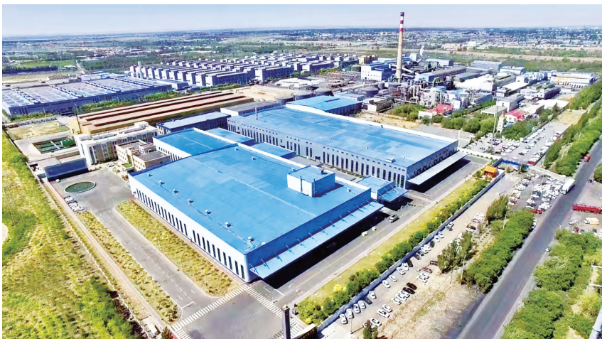
包头华鼎铜业发展有限公司、包头震雄铜业有限公司厂区全景。

在高质量发展的道路上,金川铜贵持续推动铜及贵金属产业的绿色化、智能化升级,为产业链价值链向高端攀升注入澎湃不息的绿色动能。公司秉持“精准治污、科学治