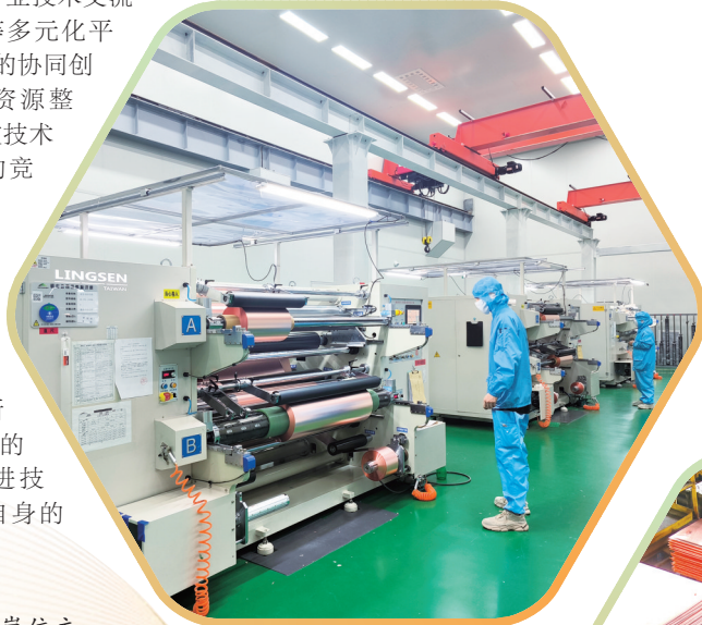
铜箔分切岗位主操手在分切机前关注分切收卷情况。

金川铜贵还在巩固国内市场领先地位的同时,积极开拓国际市场,提升在全球市场的品牌影响力与话语权。不断加强与国际知名企业的合作与交流,引进先进技术与管理经验,提升自身的国际化经营水平。