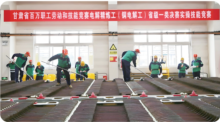
甘肃省百万职工劳动和技能竞赛电解精炼工(铜电解工)省级一类决赛实操技能竞赛。

如今,国企改革的春风,让金川铜贵再次焕发生机,以更加开放的姿态,迎接市场的挑战与机遇。金川铜贵这朵戈壁滩上的“铜花”,在更广阔的舞台上绽放出璀璨的光芒。