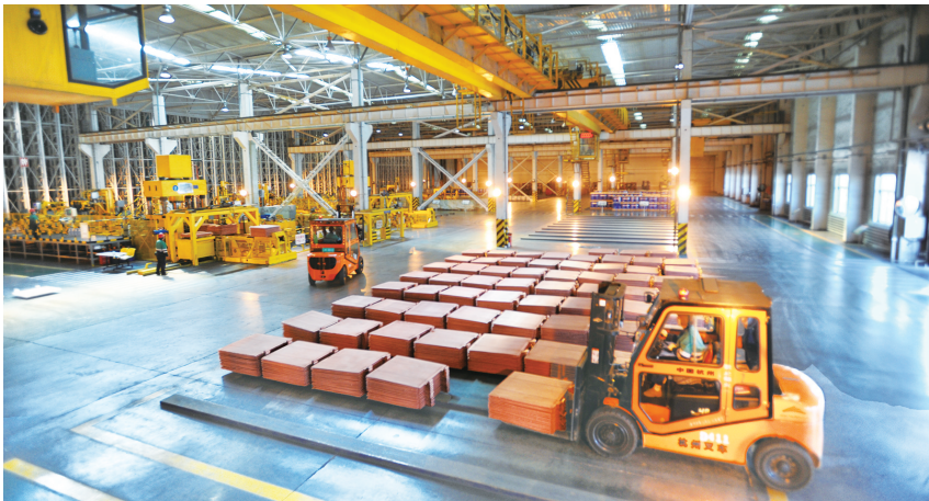
电解一分厂成品厂房叉车在进行分拣作业。

在技术的海洋中,金川铜贵匠心独运、精益求精,不断攀登行业新巅峰。从最初的“土法冶炼”到如今的世界领先,金川铜贵在火法熔炼、电解提取、贵金属提炼等多个领域取得了重大突破。