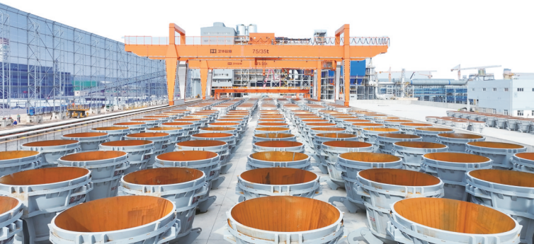
永昌铜业公司选矿厂缓冷场。

同时,金川铜贵积极拓展产品应用领域,特别是在新能源、电子信息、航空航天等高端制造业领域加大市场开发力度,与众多行业领军企业建立深度合作关系,共同推动下游产业的技术升级与创新发展,产品出口20多个国家和地区。此外,公司还不断强化质量管控体系,严格把控每一个环节的产品质量,确保产品性能和品质达到国际领先水平,赢得了客户的广泛信赖与市场的充分认可。