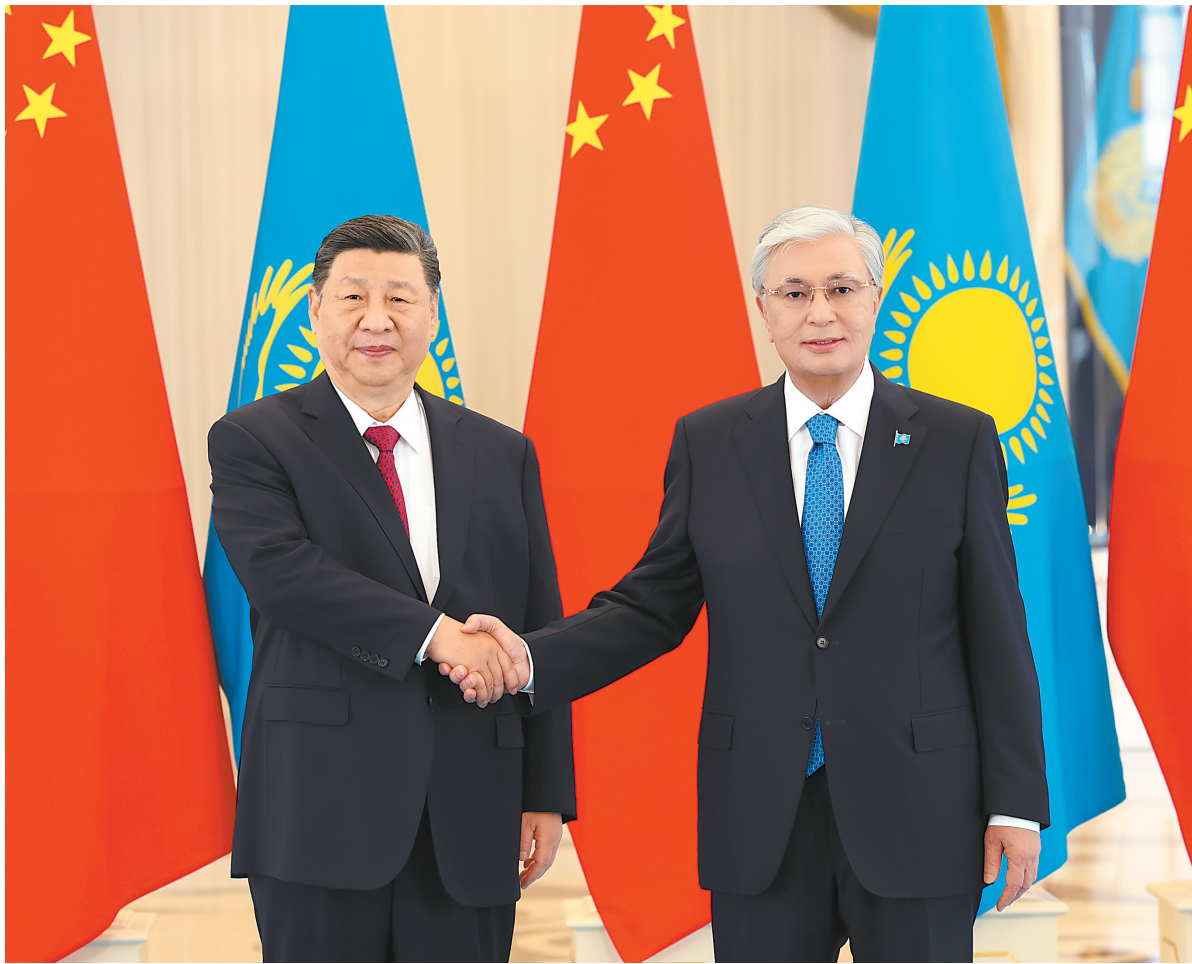
当地时间六月十六日下午，哈萨克斯坦总统托卡耶夫同中国国家主席习近平在阿斯塔纳总统府举行会谈。