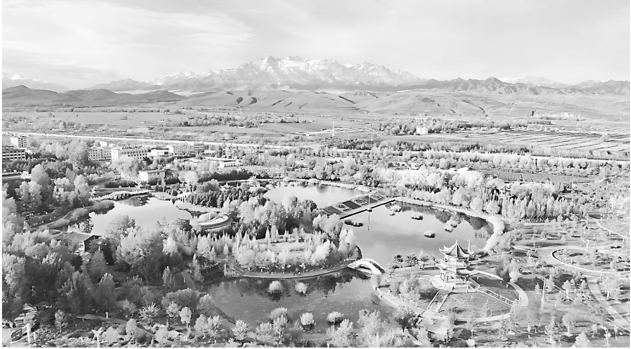
民乐县西區公園 王晓泾

（《园林揽华：中华园林文化解读》，曹林娣著，陕西师范大学出版总社出版。作者系浙江工商大学人文与传播学院副教授）