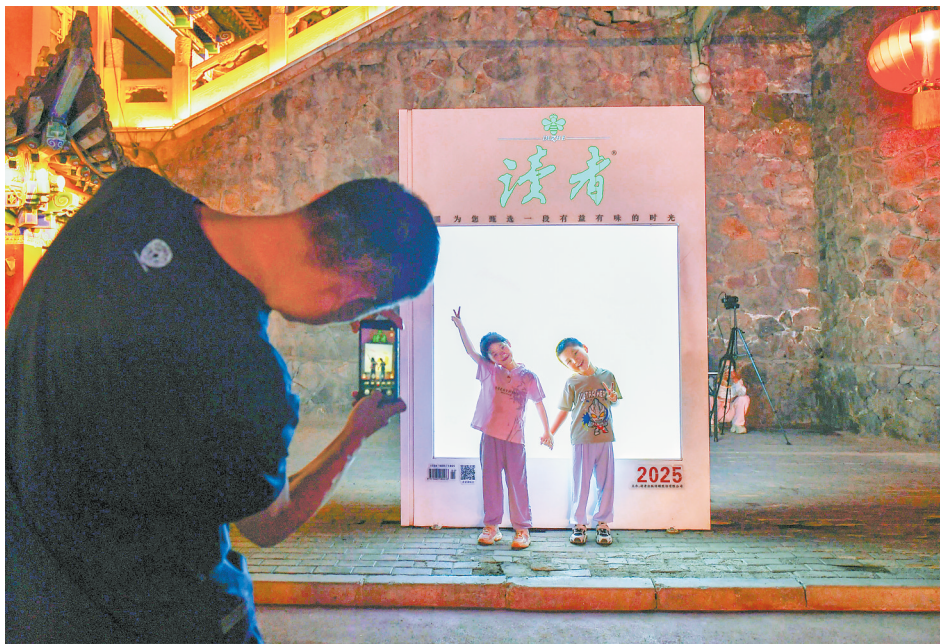
中山桥附近,家长为孩子留下美好记忆。