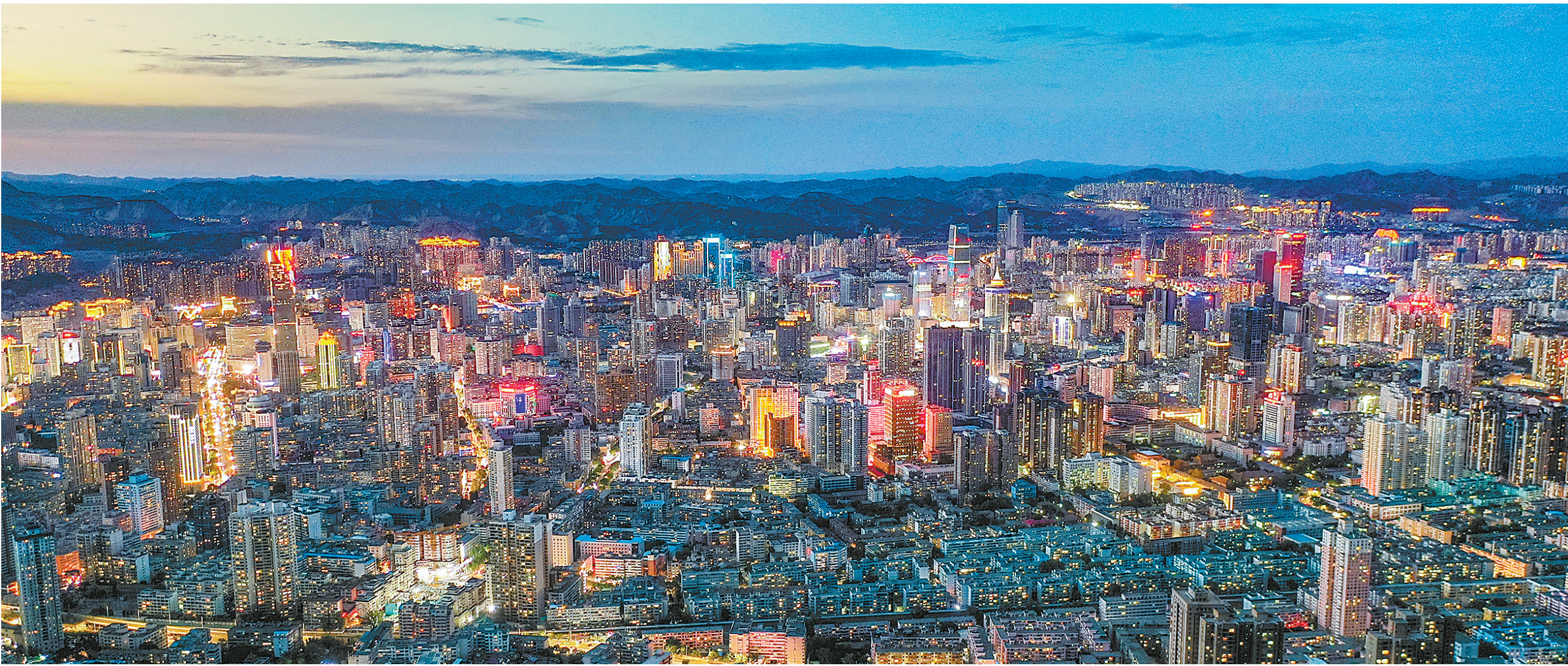
金城之夜,灯火璀璨。