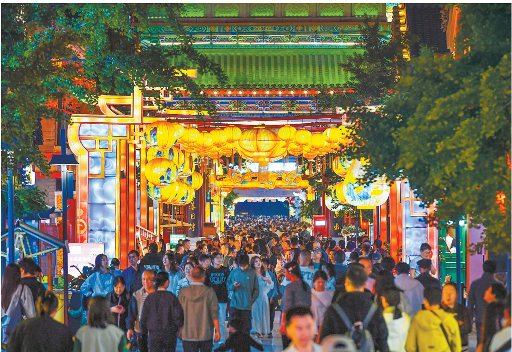
夜晚的兰州老街灯火辉煌,人头攒动。