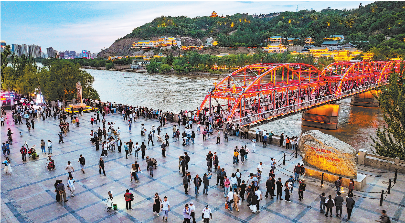
华灯初上,百年中山桥美轮美奂。