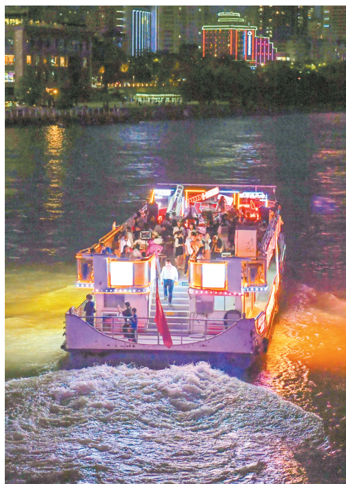
游客在游船饱览黄河之滨的美景。