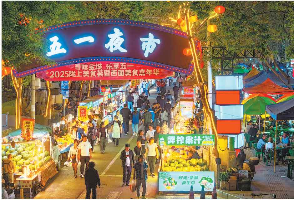
西固区五一夜市热闹非凡。