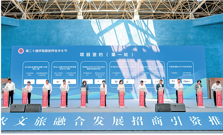
农文旅融合发展招商引资推介大会。 俄少飞