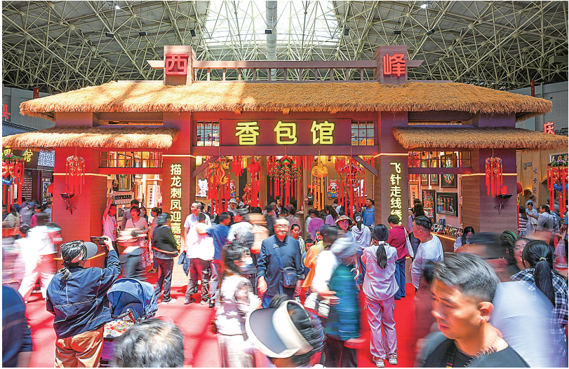
庆阳香包馆游客络绎不绝。 王志龙