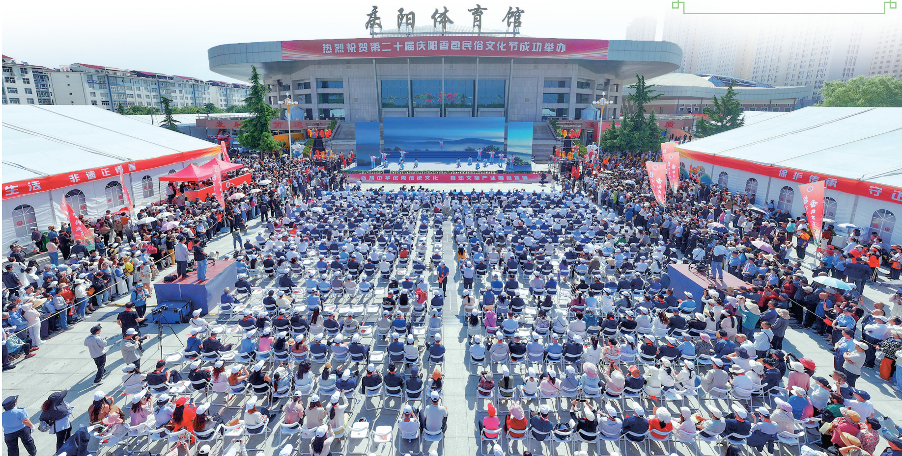
第二十届庆阳香包民俗文化节开幕式现场。 陈飞