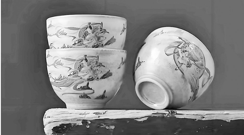
敦煌飞天茶杯 资料图

团队运用X射线荧光光谱分析技术,破译了“紫口铁足”的工艺密码,即将胎土中的紫金土含量精确控制在18%—22%,烧成温度控制在1230℃±10℃的区间。这种将材料科学与传统工艺相结合的实证研究,拓展了手工器物美学的研究维度。