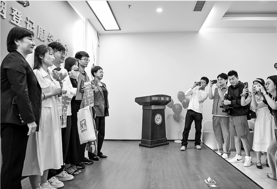
5月20日,兰州市迎来结婚登记小高峰。当天,城关区民政局婚姻登记处为新人举办了庆祝仪式。新甘肃·甘肃日报记者 丁 凯

永登县民政局结合当地民俗文化,为有意愿的8对新人举办了2025年“玫瑰之乡·浪漫之约”集体婚礼,倡导新型婚育文化、树立文明婚育新风。七里河区人民法院通过向新人发放《抵制高额彩礼 培树婚嫁新风倡议书》,宣讲移风易俗、抵制高额彩礼相关政策,倡导简约适度、绿色低碳的文明婚俗新风。