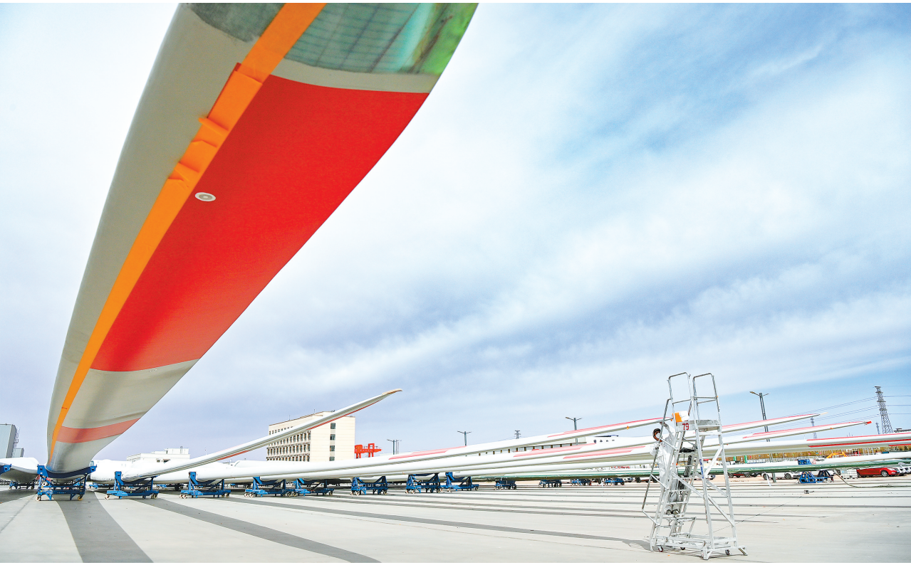
远景武威民勤智能风机制造基地二期项目。