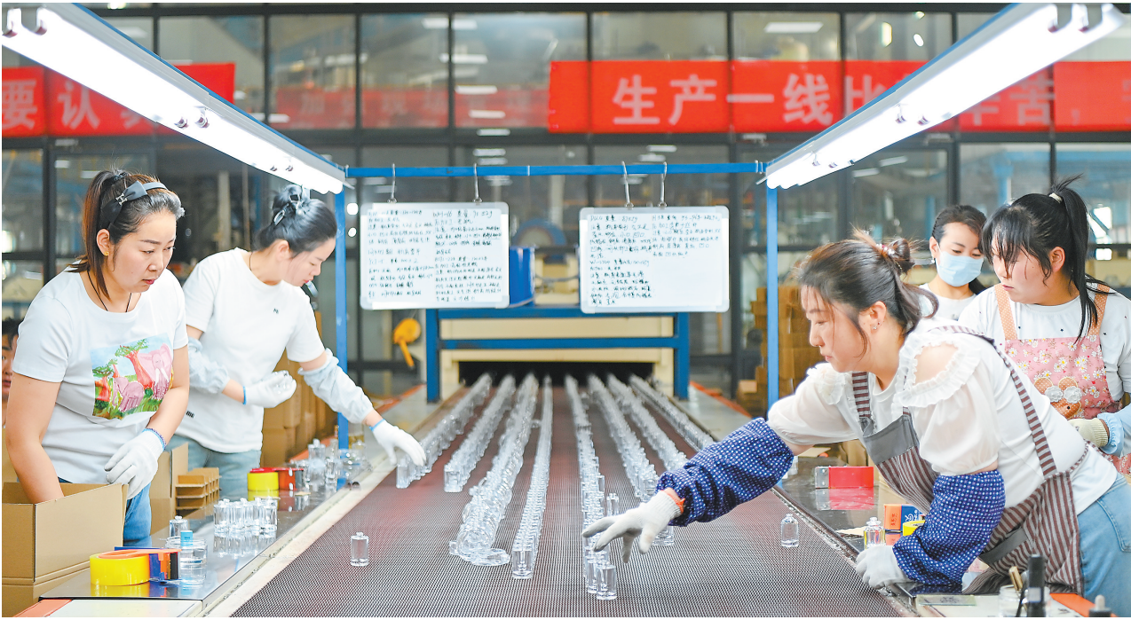
甘肃富地金虹玻璃制品有限公司为国际知名品牌化妆品生产玻璃容器。