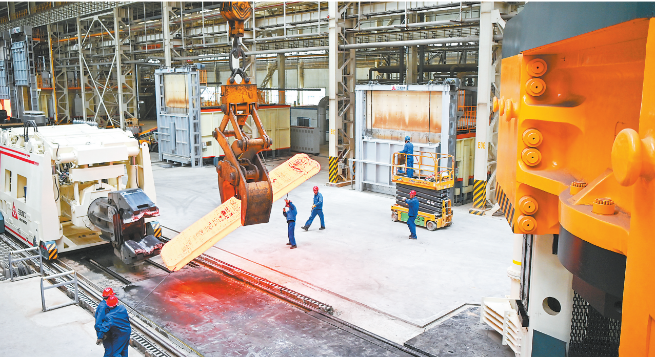
兰石集团 125MN 智能快速锻造液压机组调试设备。