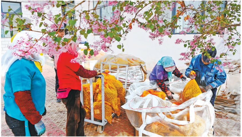
甘肃鼎峰马铃薯种业有限公司基地工人分拣马铃薯原种。