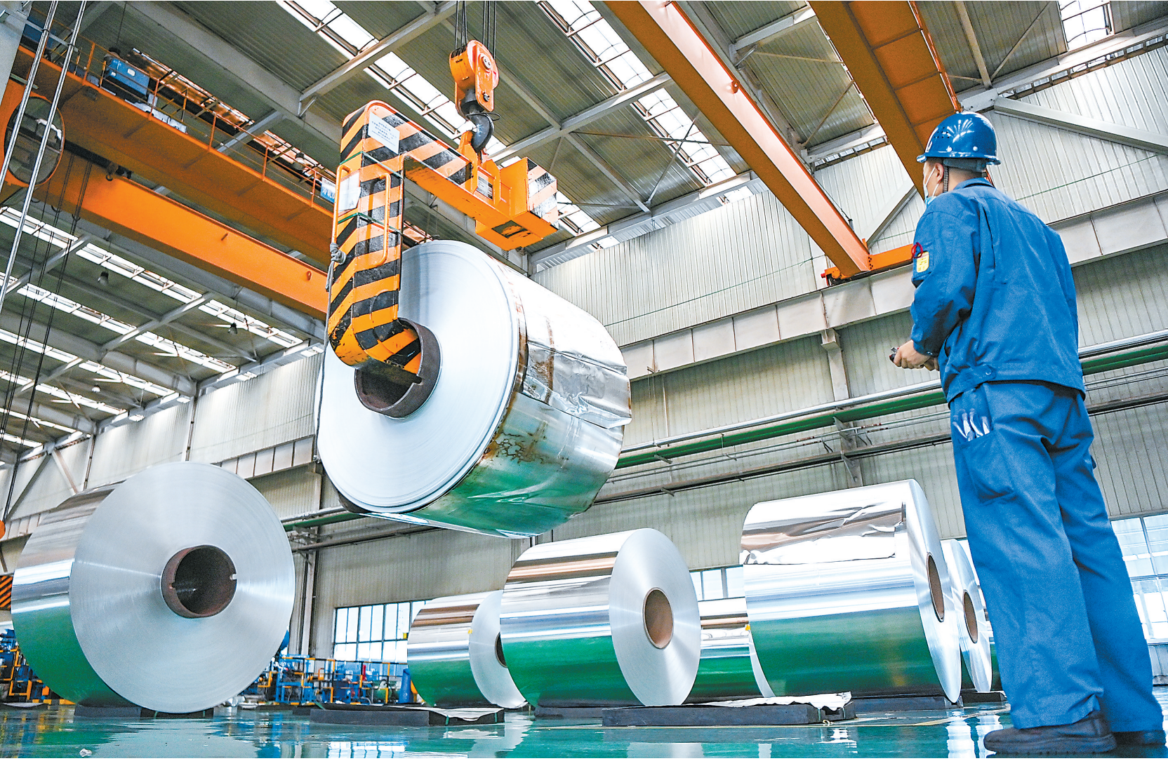
东兴嘉宇铝合金板带生产现场。