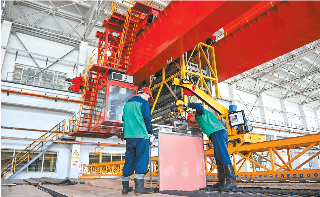
金川集团铜贵有限公司电解分厂。