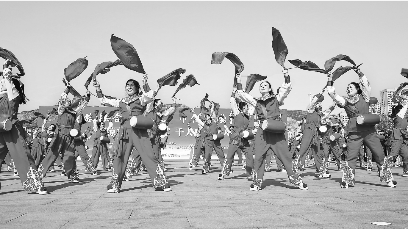
平凉市举办千人广场舞大赛。

春日里,崆峒区绿地广场人声鼎沸,热闹非凡,“体旅融合舞春风·巾帼逐梦绽芳华”千人广场舞大赛正在火热进行中。赛事期间,平凉市女企业家协会同步推出“陇姐优品”主题商贸活动,聚焦妇女儿童用品、家政服务等领域,通过线上线