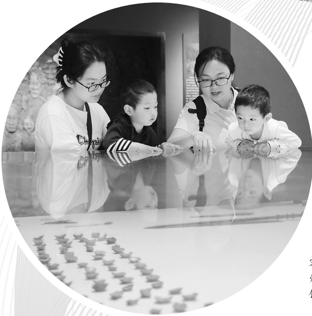
近日，游客在湖南省永州市道县博物馆参观。