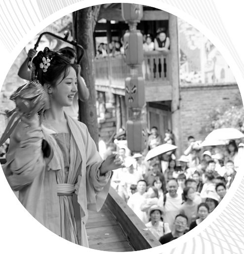
近日，在贵州省遵义市乌江寨景区，身着传统服饰的年轻人与游客进行抛绣球互动。