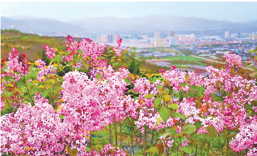
丁香花开。