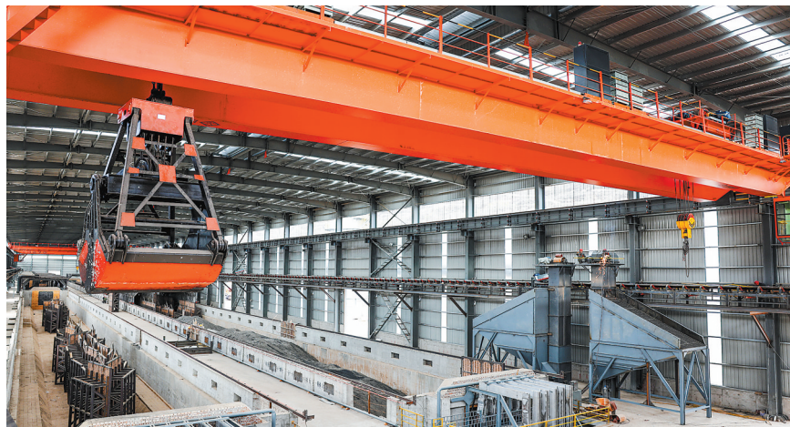
清水县复合陶瓷耐材一体化综合循环利用项目建设现场。