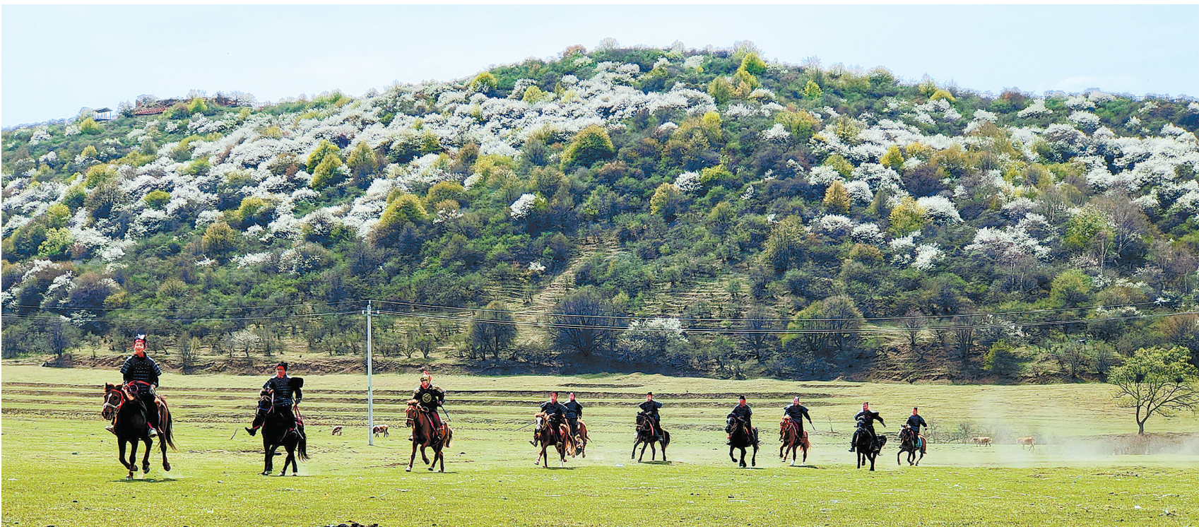
山花盛开的非子牧场。