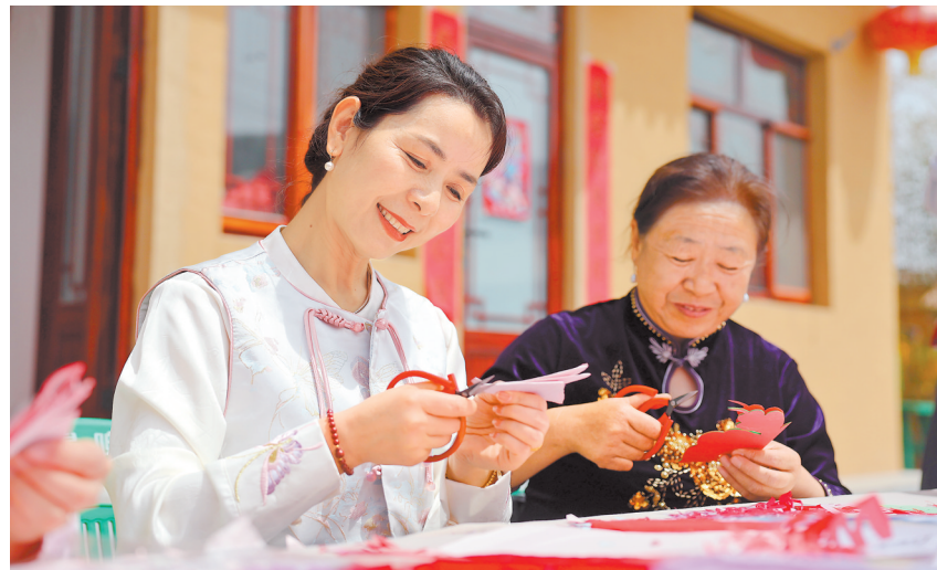
剪纸艺术展示。新甘肃·甘肃日报通讯员 王福萍