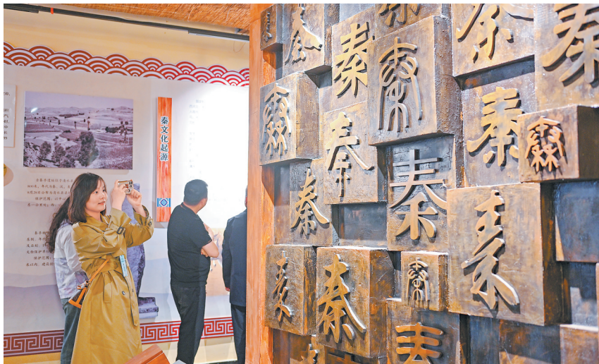
秦亭镇秦文化博物馆。