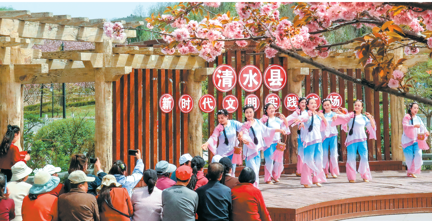
惠民演出丰富群众文化生活。新甘肃·甘肃日报通讯员 唐国因