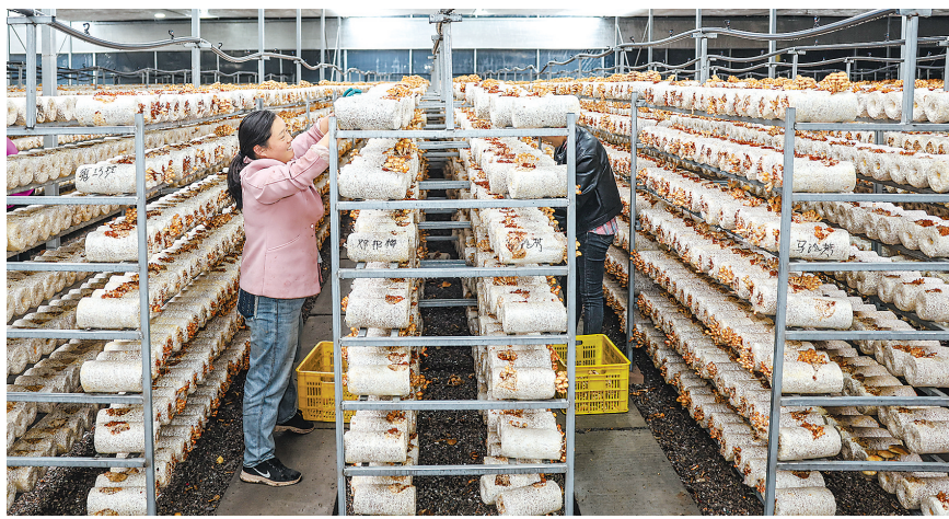
白沙镇食用菌产业园标准化示范种植基地。