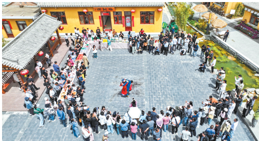
木人摔跤表演。