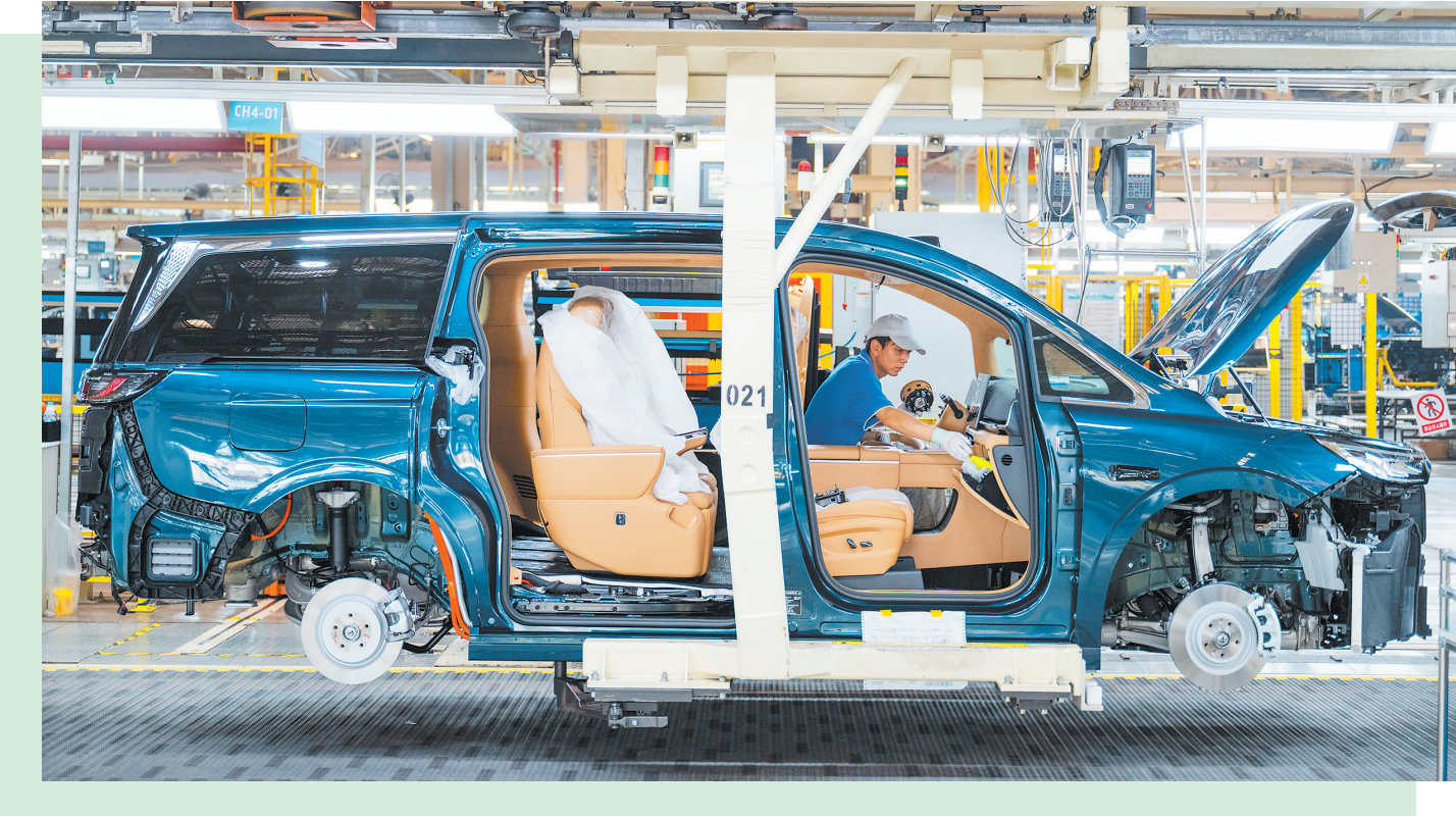
近日,在位于湖北武汉经开区的岚图汽车数字化总装车间,工人在流水线上作业。

2024年7月,我国新能源乘用车在国内市场的月度零售销量,首次超越传统燃油车。这一标志性变化意味着新能源车正逐步成为市场新宠。 今年一季度,我国新能源汽车产销量延续高增长态势,累计分别完成318.2万辆和307.5万辆。其中,新能源汽车