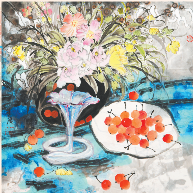
花语(中国画)徐志鸿