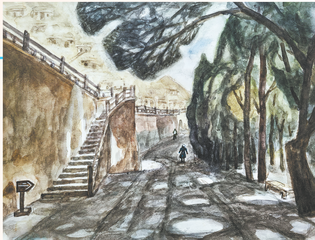
西千佛洞(水彩画)王玉芳