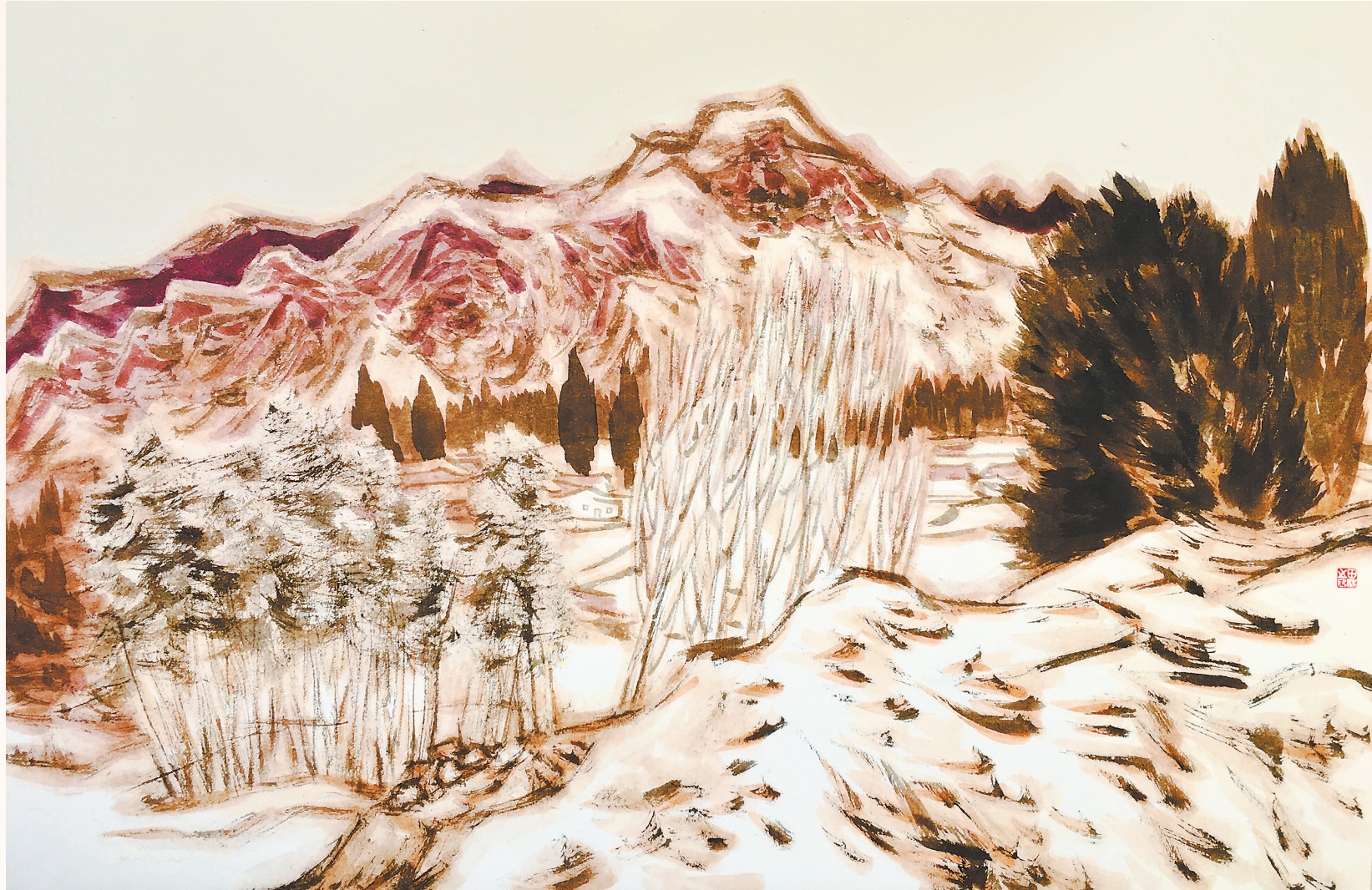
河西印象(中国画)田苗