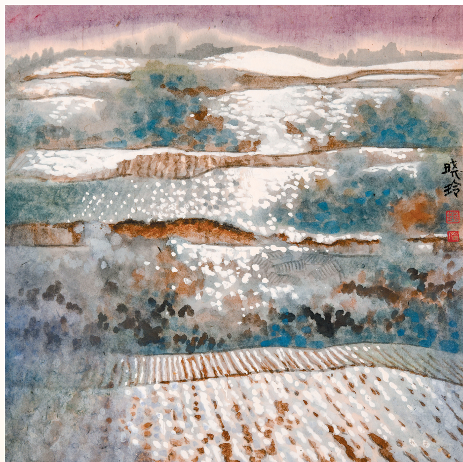
静静的塬上(中国画)赵晓玲