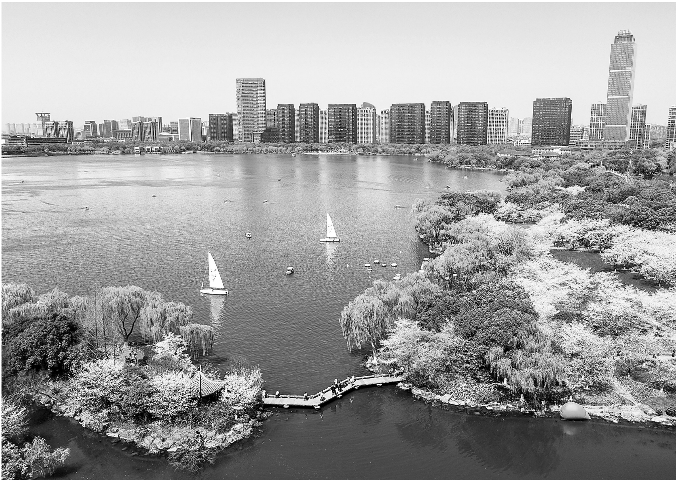
这是3月24日拍摄的绍兴柯桥区瓜渚湖畔的春日美景。随着近期气温升高,浙江省绍兴市柯桥区瓜渚湖畔的樱花和郁金香大面积盛开,吸引游客前来赏花踏青。

通知还要求各各地人社部门持续深化政银合作,积极拓展稳岗扩岗专项贷款合作银行范围,探索开发数字化、线上化稳岗扩岗专项贷款产品。