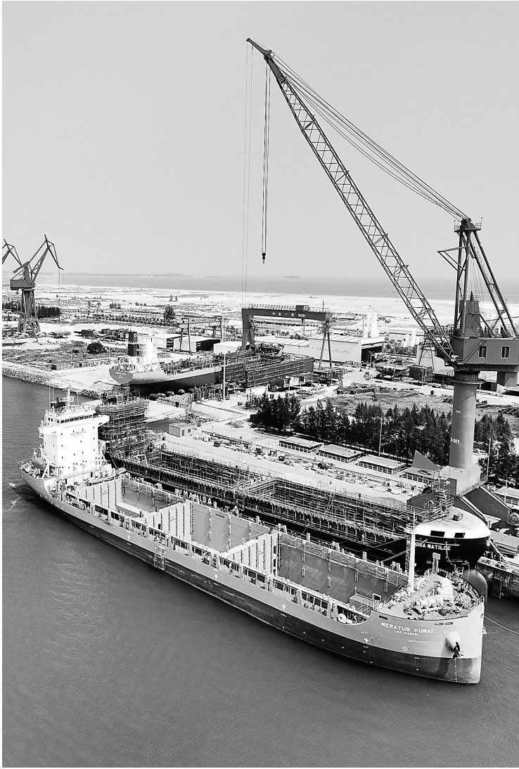
中国船舶集团广西造船有限公司船舶建造现场(3月20日摄)。记者3月21日从中国船舶集团广西造船有限公司获悉,目前,该公司造船订单已排至2027年底。