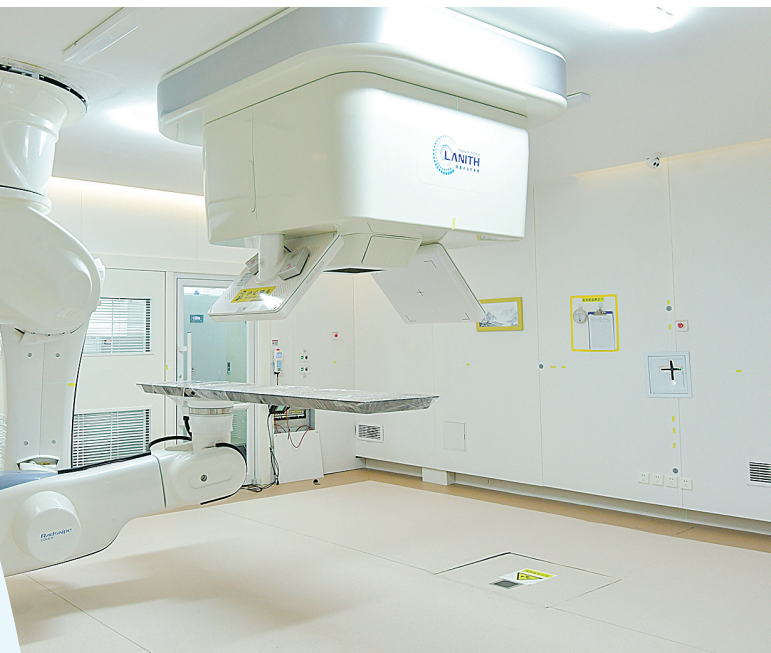
首台中国重离子治疗系统3号治疗舱。