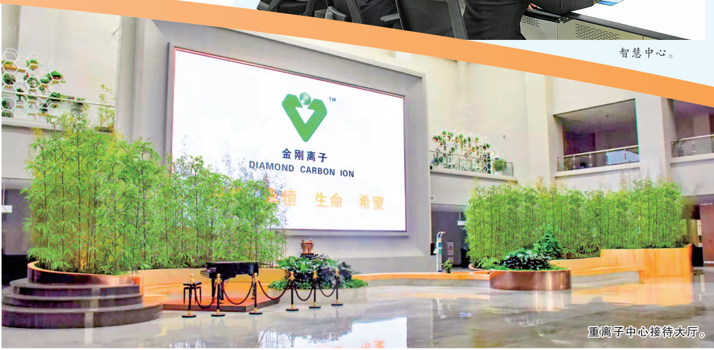
重离子中心接待大厅。