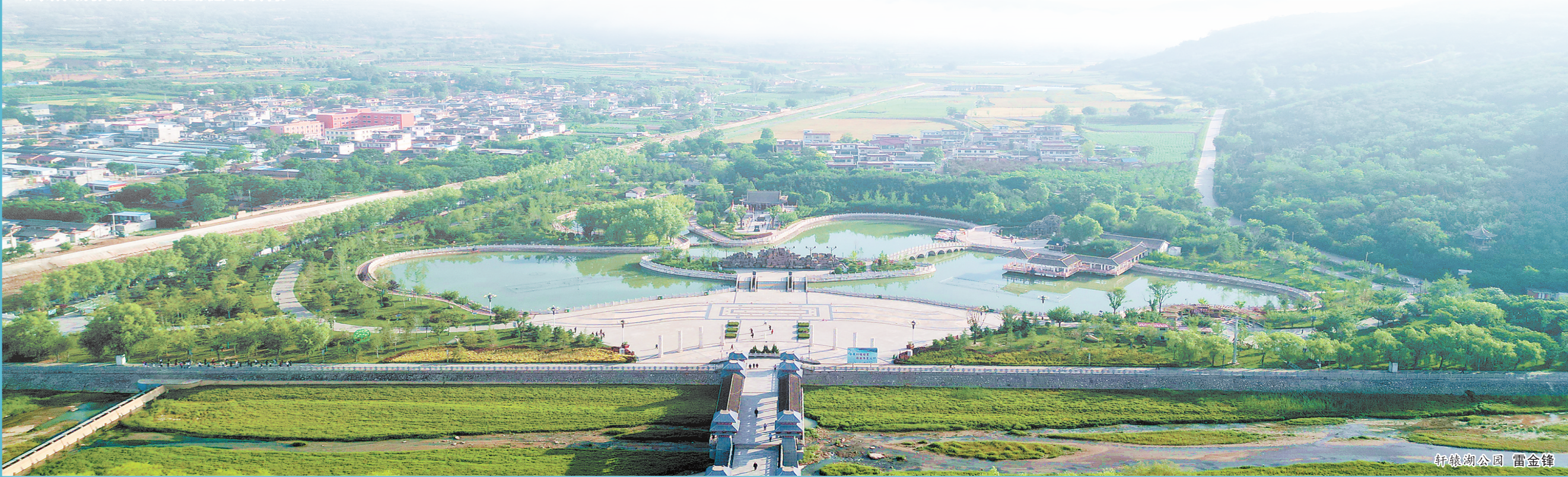
轩辕湖公园 雷金锋