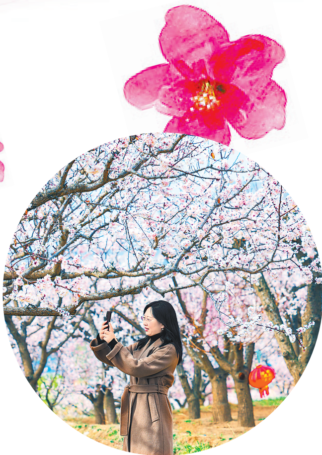
东乡唐汪镇河沿村杏花绽放 田 蹊

交织在一起，肆意地铺展在这片土地上。那一朵朵杏花，簇拥在枝头，像是繁星坠落人间，又似天边的云霞倾洒而下。它们有的粉如少女羞涩的脸颊，带着几分俏皮与娇俏；有的白如初雪，纯净而又素雅，散发着一股宁静而悠远的美。 微风轻轻拂过，空气中便弥漫起淡淡的花香，那是杏花独有的清甜气息，萦绕在鼻尖，让人心旷神怡。漫步在杏花村的乡间小道上，脚下是软绵绵的花瓣，头顶是繁花似锦的杏树，仿佛置身于一个与世隔绝的世外桃源。远处，几座古朴的农舍错落有致地分布在花海之中，袅袅炊烟从屋顶升起，为这片宁静的美景增添了几分人间烟火气。耳边，不时传来鸟儿欢快的歌声，它们在枝头跳跃嬉戏，与这烂漫的杏花相映成趣，共同奏响了一曲春天的乐章。 赏花景点推荐：安宁仁寿山、永登苦水镇、皋兰什川梨园