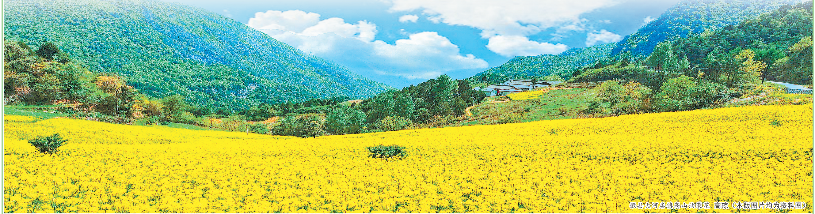
徽县大河店镇高山油菜花 高琼（本版图片均为资料图）

人的景致。 漫步其间，脚下是簌簌作响的花瓣，头顶是纷飞的花雨，眼前是粉白交织的花海，耳边是微风的呢喃和花瓣飘落的簌簌声，那一刻，尘世的喧嚣都被远远抛在身后，只剩下内心的宁静与沉醉。新阳镇的杏花，不仅是大自然馈赠的美景，更是这片土地上人们生活的一部分。它们见证了黄土高原的沧桑变迁，陪伴着一代又一代的人度过美好的时光。每一朵杏花都承载着希望与梦想，在这片黄土地上绽放出最绚烂的光彩。 赏花景点推荐：秦安凤山景区、甘谷大像山公园、清水花石崖景区