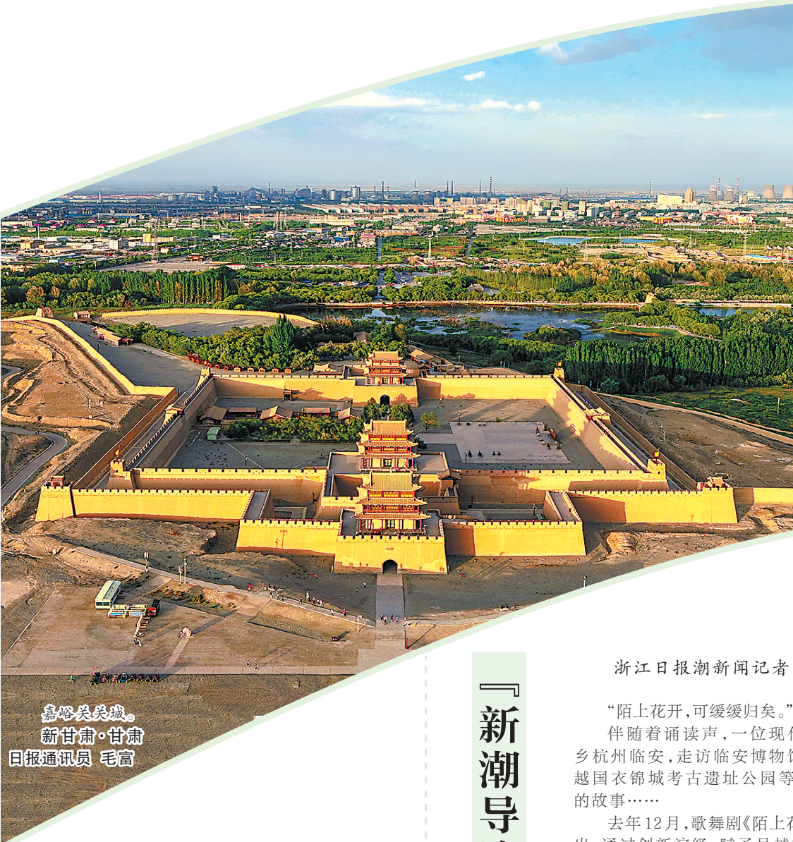
嘉峪关关城。

建议对品质较高的旅游度假区、休闲街区、4A级以上景区,由省级层面统一建设高级资源库,打造“政产学研”统筹咨询决策体系,优先鼓励省属企业主导开发。进一步加强“文旅+百业”“百业+文旅”融合发展,助推旅游与文化、科技、教育、体育等行业深度嫁接,培育数字沉浸、研学体验、体育健身等消费新业态,构建甘肃特色“兰马体育游”“丝路文化遗产游”“黄河生态游”等农、文、体、商、旅融合产品体系。(新甘肃·甘肃日报记者白永萍整理)