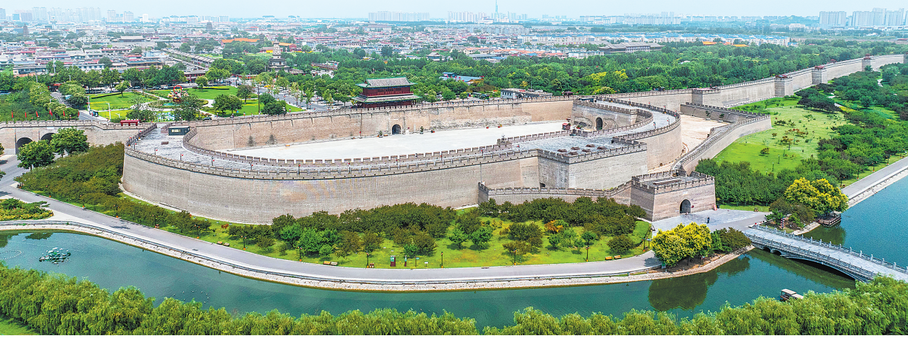
正定古城南城门。

文脉“活化”重在文化的深度挖掘。以文塑旅,最重要的核心在于发挥地方特色,挖掘出它独特的文化属性。浙江是一个历史文化底蕴非常丰厚的省份,将这些珍贵的文脉资源进一步活化利用,与新时代发展相结合,这样才能走到人们的心坎里去,才能让世界了解更加多元的中华文化。(浙江日报潮新闻记者包一圣整理)