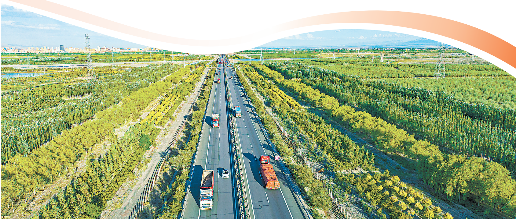
张掖市倾力打造沿路沿线高标准“生态绿色走廊”。