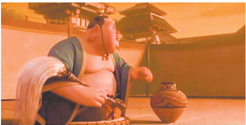
漩涡纹彩陶罐(本版图片均为资料图)

在甘肃省博物馆收藏有一个漩涡纹彩陶罐,陶罐无论是纹饰还是外形都和小哪吒刚出生时太乙真人喝酒的容器相似。甘肃省博物馆馆藏的漩涡纹彩陶罐高22.5厘米,口径14.1厘米,底径10.6厘米。罐身施红、黑彩,口沿内彩,有横竖平行条纹相间排列,腹部绘红、黑彩多条相间漩涡纹五组。早期的漩涡纹方向既有顺时针也有逆时针,后来全都变成逆时针,与现实中水流漩涡的方向一致。这种设计不仅反映了先民们对自然规律的深刻理解,也展现了他们对生活的热爱和创造力。