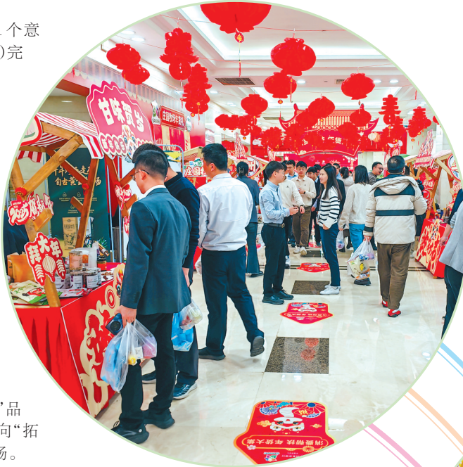
2025年1月,“甘味”农产品进入中国农业银行总行年货盛宴。

走出去,请进来。甘肃在全国各地强力开展品牌营销,扩大“甘味”品牌推广覆盖面,同时邀请客商来甘洽谈对接,展示具有浓郁陇原特色“乡味”的“甘味”品牌。