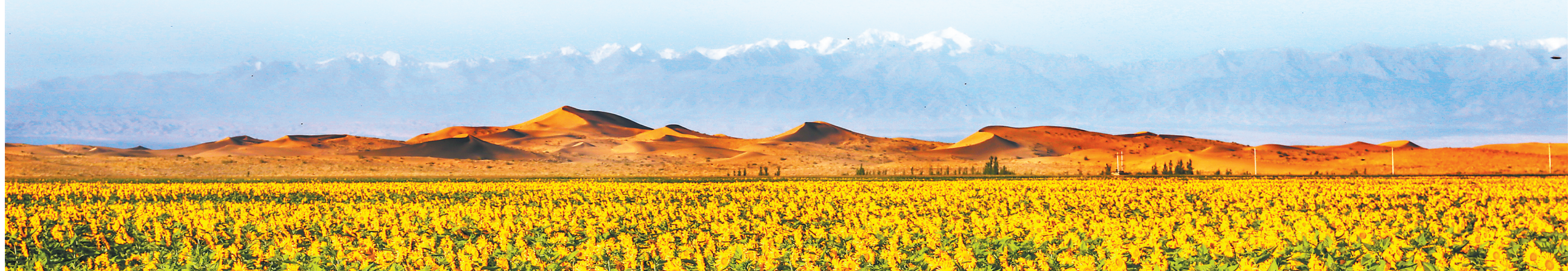
蓝天净土、绿色生产,共同塑造了“甘味”特质。

东风劲吹,甘肃上下只争朝夕、真抓实干,跳起摸高、善作善成,让“甘味”之花开遍全国,“甘味”品牌,为农民增收、农业增效、农村发展加油助力,正在书写乡村振兴的“甘味”答卷。