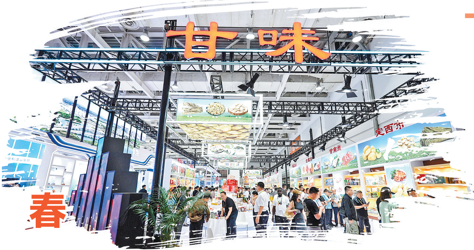
2024年6月,第十三届中国中部投资贸易博览会在长沙举办,“甘味入湘”活动同期开展。

甘肃以绿色发展为方向,筑牢“甘味”品质硬支撑。目前有11个“甘味”区域公用品牌入选农业农村部精品培育计划,居全国第四位;6个品牌纳入中欧地理标志互认互保清单。