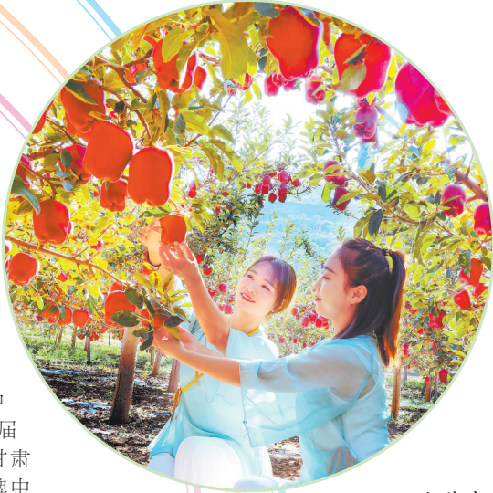
天水花牛苹果丰收。

十个品牌记不住,一个品牌能叫响。“甘味”构建起“省级公用品牌+市县区域品牌+企业商标品牌”三级融合、协同发展、互为支撑的品牌建设体系。通过政府、市场两手并用,省市县三级联动,政府、企业、行业协会共同发