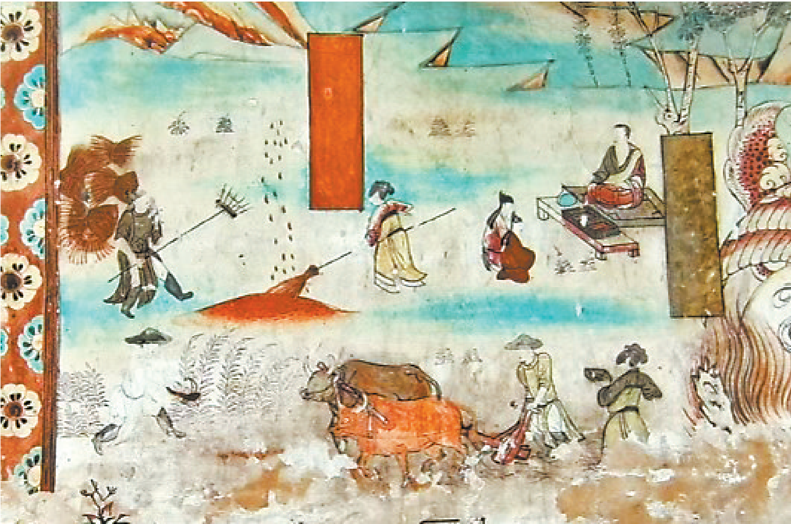
耕作 榆林窟第25窟 中唐