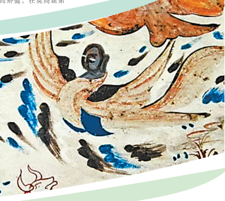
千秋长命鸟 莫高窟第249窟 西魏