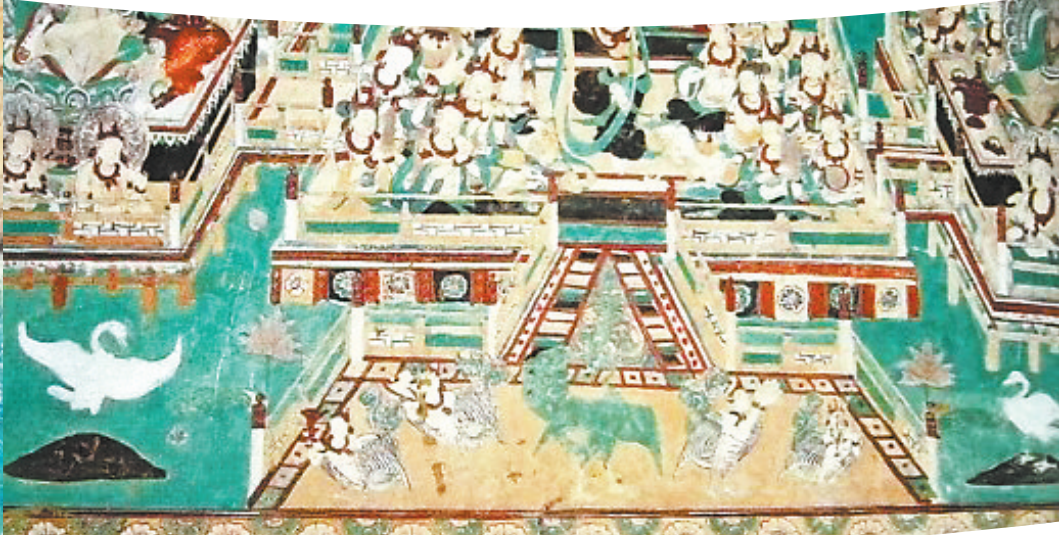
天鹅 莫高窟第360窟 中唐