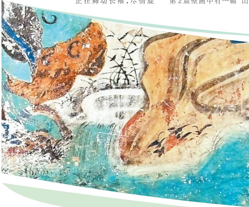
山间流水 榆林窟第2窟 西夏