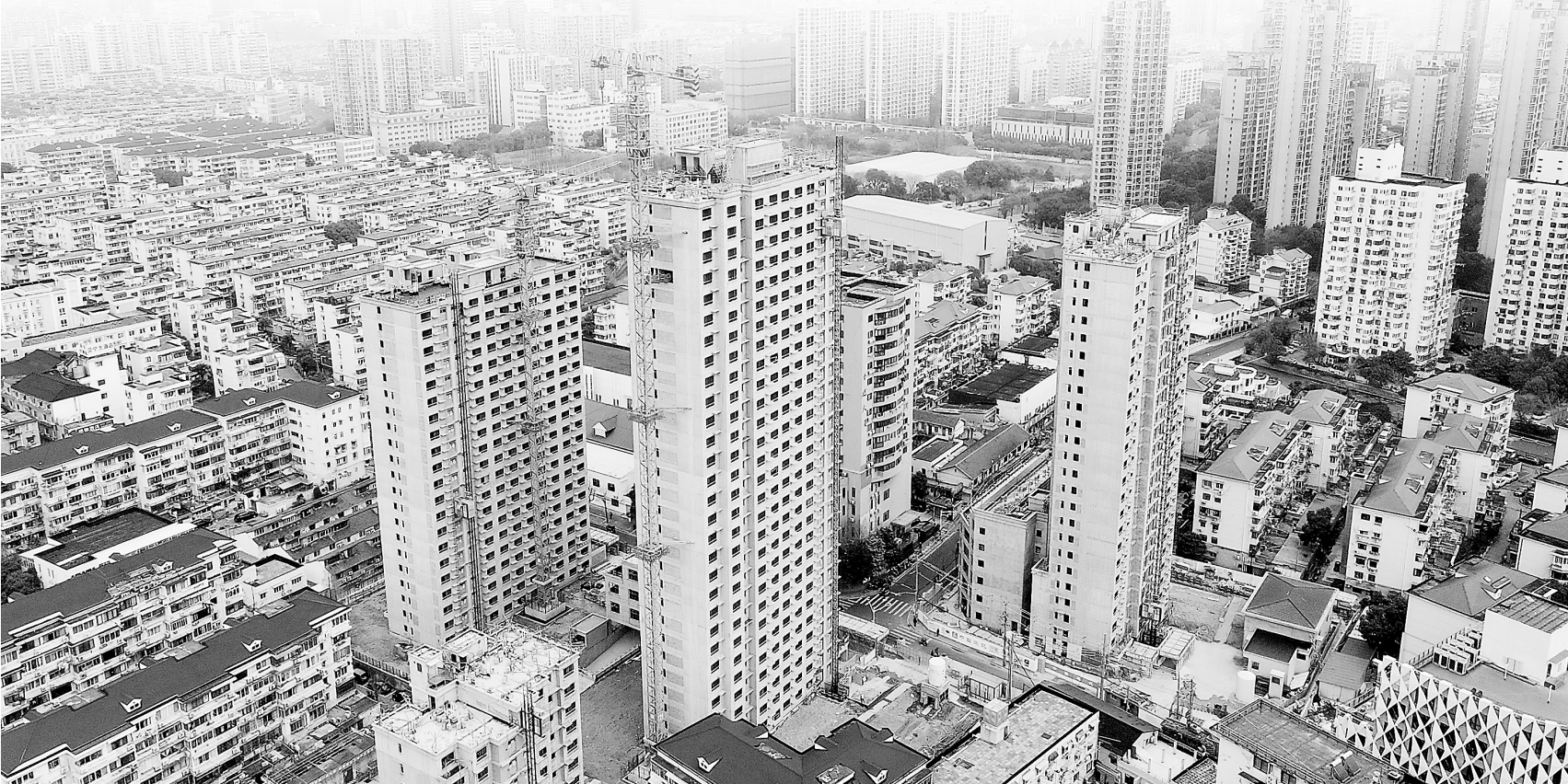
上海市静安区谈家桥城市更新项目建设工地(2024年3月15日摄)。