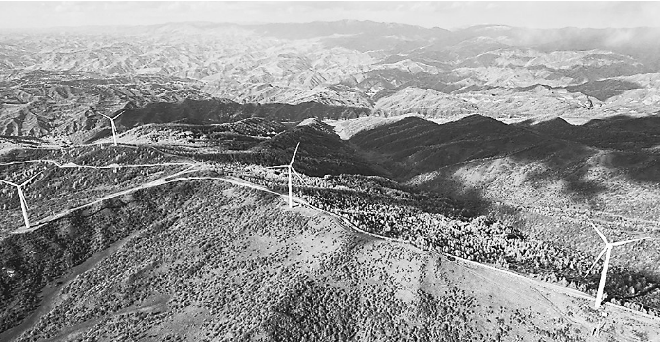
张家川百里关山观光走廊 资料图