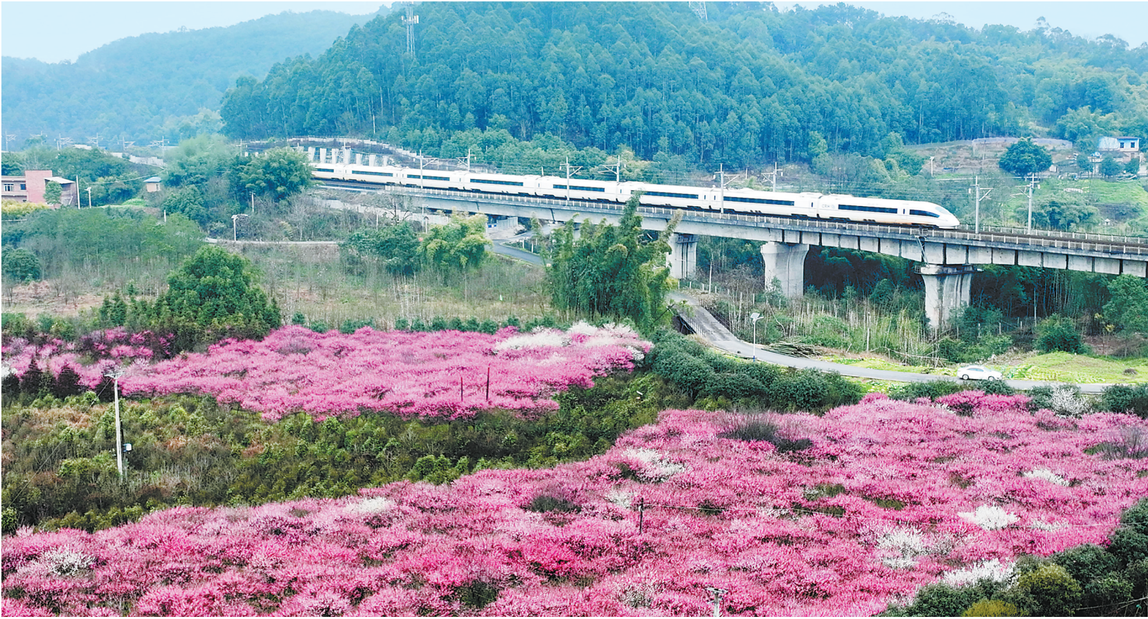
早春时节，随着气温转暖，花儿渐次开放，给人们带来春的气息。图为重庆市永川区大安街道德胜桥村，一列高铁列车驶过一片梅花花海。

山东省淄博市淄川区人社局开通抖音短视频账号，自2021年7月开展线上直播带岗以来，实现了人才和企业的精准对接，目前已累计直播1656场，观看人次超800万。 （新华社北京2月21日电）